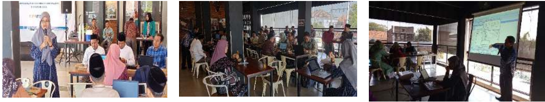
Gambar 3. Pelaksanaan Kegiatan Pengabdian kepada Masyarakat

Langkah kedua adalah Focus Group Discussion dan pemberian teknologi baru. Setelah fase observasi, wawasan dan data yang terkumpul sering dibahas dan dibagikan dalam forum atau diskusi kelompok. Ini berfungsi sebagai platform untuk bertukar ide, berbagi temuan, dan berinteraksi dengan pemangku kepentingan, yang dapat mencakup pengelola koperasi pondok pesantren. Pengenalan teknologi baru juga akan terjadi selama fase ini, di mana alat atau sistem inovatif seperti Sistem Akuntansi berbasis open source diperkenalkan untuk meningkatkan praktik akuntansi dan manajemen keuangan seperti yang ditunjukkan pada Gambar 3.