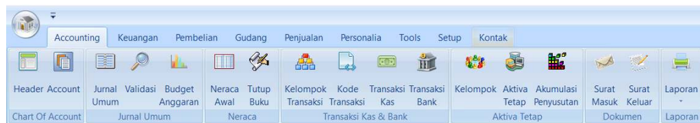
Gambar 4. Tampilan Menu Sistem Koperasi

Sistem akuntansi berbasis open source ini menyederhanakan manajemen keuangan koperasi pondok pesantren dengan fitur-fitur yang mudah digunakan. Sistem ini mencakup pencatatan transaksi, manajemen data, pembuatan laporan keuangan, dan analisis kinerja. Sistem ini menyederhanakan pencatatan keuangan harian untuk koperasi pondok pesantren. Fitur sistem ini membantu koperasi pondok pesantren dalam mematuhi standar akuntansi. Sistem ini mengikuti standar akuntansi Indonesia, sehingga pencatatan transaksi keuangan menjadi mudah dan sistematis. Aplikasi ini menggunakan sistem input entri tunggal, sehingga mudah diakses bahkan oleh pengguna dengan pengetahuan akuntansi yang terbatas. Tampilan menu sistem ini seperti yang ditunjukkan pada Gambar 4.