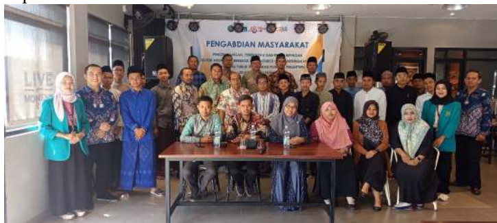
Gambar 5. Peserta Mitra Pengabdian Masyarakat

Pondok Pesantren di Kabupaten Kudus, telah meningkatkan pemahaman peserta tentang Sistem Akuntansi dan konsep Akuntabilitas Publik.