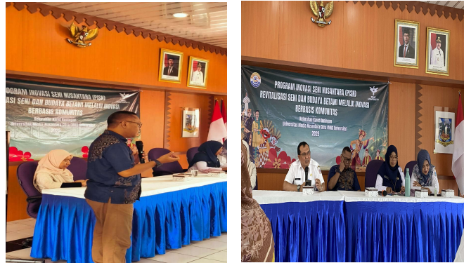
Gambar 1. Kegiatan Pelatihan Branding

Dengan demikian, kita dapat meningkatkan kesadaran pelanggan dan membuat produk kita lebih kompetitif di pasar. Mari kita manfaatkan materi branding ini untuk meningkatkan kemampuan kita dalam merancang branding yang efektif dan meningkatkan daya jual produk kita. Dengan branding yang kuat, kita dapat meningkatkan kesadaran pelanggan dan membuat produk kita lebih sukses di pasar.