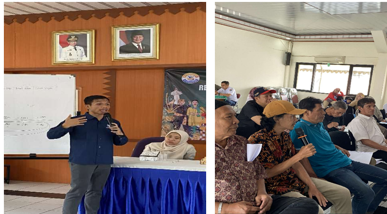
Gambar 4. Kegiatan sosialisasi dan pelatihan media sosial

Melalui kegiatan ini, warga kelurahan tidak hanya memperoleh pengetahuan baru, tetapi juga menghasilkan konten nyata yang dapat digunakan sebagai media informasi serta branding positif bagi lingkungan mereka. Kegiatan PISN ini diharapkan menjadi langkah awal dalam mendorong masyarakat untuk terus kreatif, produktif, dan adaptif terhadap perkembangan teknologi digital.