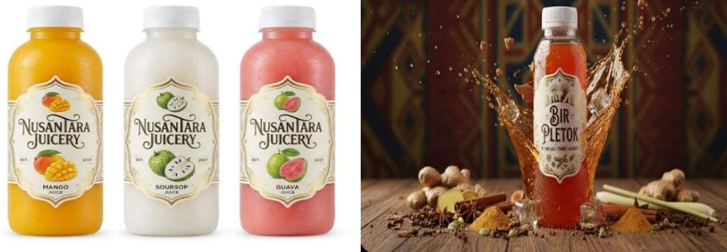
Gambar 2. Hasil desain branding beberapa produk UMKM.