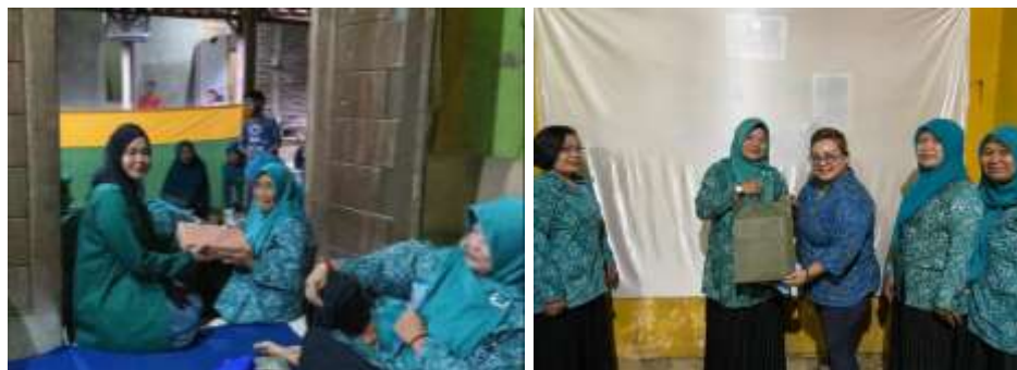
Gambar 2. Penyerahan hadiah sesi tanya jawab kepada anggota PKK dan Penyerahan buah tangan kepada ketua PKK

Selain memberikan penyuluhan materi kepada Masyarakat, Tim pengabdian Masyarakat juga mengadakan sesi tanya jawab, games kepada anggota PKK, dan pemberian buah tangan kepada ketua PKK. Sesi tanya jawab ini bertujuan agar masyarakat bisa lebih terlibat dalam memahami dan mempelajari tentang cara mencegah terjadinya stunting. Selain itu, kegiatan sosialisasi tentang stunting juga membahas tentang kebersihan lingkungan karena salahsatu faktor yang terjadi adalah sampah yang berada di sekitar lingkungan Masyarakat (Idrus et al., 2022).