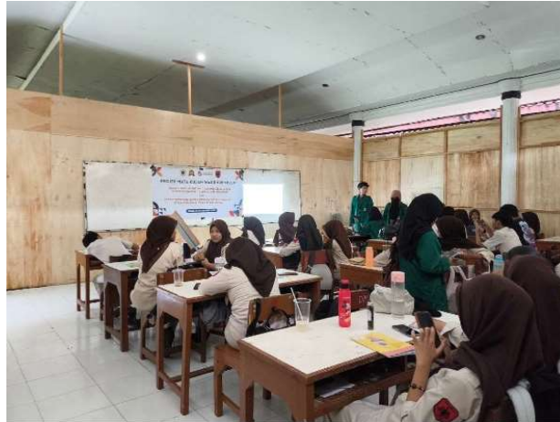
Gambar 2. Tanya Jawab

memberikan kesempatan kepada siswa untuk terlibat aktif dalam memahami konsep toleransi, sikap saling menghargai perbedaan, dan pentingnya kebinekaan dalam kehidupan bermasyarakat. Suasana pembelajaran yang kondusif serta tingginya partisipasi siswa selama kegiatan berlangsung mencerminkan antusias peserta terhadap materi yang disampaikan. Dokumentasi ini merepresentasikan pelaksanaan kegiatan inti pengabdian sekaligus menunjukkan bahwa proses edukasi toleransi telah sejalan secara terstruktur, komunikatif, dan berkelanjutan sebagai bagian dari upaya penguatan Pendidikan karakter di lingkungan sekolah.