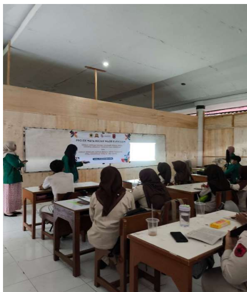
Gambar 1. Pemaparan Materi

Pada akhir kegiatan, siswa diminta menuliskan refleksi mengenai pemahaman baru yang mereka peroleh setelah mengikuti sosialisasi. Mayoritas siswa menyatakan bahwa mereka mulai menyadari bentuk-bentuk intoleransi yang sebelumnya tidak mereka sadari, seperti candaan berlebihan, pengabdian pendapat teman, dan sikap kurang empatik dalam pergaulan. Siswa juga menyampaikan komitmen untuk lebih berhati-hati dalam bersikap serta menjaga keharmonisan hubungan sosial di lingkungan sekolah. Refleksi ini menunjukkan adanya peningkatan literasi toleransi dan kesadaran kebinekaan siswa setelah mengikuti kegiatan edukasi toleransi di SMA Negeri 2 Boyolali.