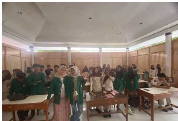
Gambar 3. Foto Bersama Tim Pengabdian dan Peserta

Gambar 2. Gambar ini menampilkan pelaksanaan sesi tanya jawab antara tim pengabdian dan peserta kegiatan edukasi toleransi di SMA Negeri 2 Boyolali. Kegiatan tersebut dilaksanakan setelah penyampaian materi sebagai upaya penguatan pemahaman siswa terhadap konsep toleransi, kebinekaan, serta sikap saling menghargai perbedaan dalam konteks kehidupan sekolah maupun masyarakat. Melalui sesi tanya jawab ini, peserta didik memperoleh kesempatan untuk mengemukakan pendapat, berbagai pengalaman, serta mengajukan pertanyaan yang berkaitan dengan materi yang telah disampaikan, sehingga proses pembelajaran berlangsung secara interaktif dan penerapan nilai-nilai toleransi dalam kehidupan sehari-hari. Interaksi dua arah yang terlihat pada dokumentasi ini menunjukkan partisipasi aktif peserta dan suasana diskusi yang komunikatif. Kegiatan tanya jawab ini berperan penting dalam menumbuhkan sikap kritis, keterbukaan, dan empati siswa, sekaligus menjadi indikator bahwa tujuan edukasi toleransi sebagai bagian dari penguatan Pendidikan karakter dapat tercapai secara efektif.