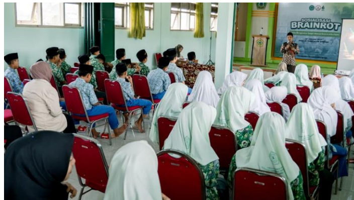
Gambar 1. Pelaksanaan Sosialisasi Literasi Digital tentang Penggunaan Gadget dan Brain Rot pada Siswa MTs di Desa Wotan

Hasil pada Tabel 1 menunjukkan bahwa kegiatan sosialisasi tidak hanya menarik minat siswa, tetapi juga mampu meningkatkan pemahaman mereka terhadap fenomena brain rot. Istilah brain rot merupakan konsep yang relatif baru bagi sebagian besar siswa MTs. Namun, peserta mampu mengaitkan konsep tersebut dengan pengalaman pribadi, seperti kesulitan fokus saat belajar, kecenderungan menunda tugas, serta kebiasaan mengonsumsi konten digital secara berlebihan. Siswa juga mulai menunjukkan peningkatan kesadaran yang ditandai dengan munculnya pertanyaan kritis terkait durasi penggunaan gadget, pengaruh konten digital terhadap konsentrasi belajar, serta keterkaitan antara penggunaan gadget dan kesehatan mental. Hal ini menunjukkan bahwa materi sosialisasi relevan dengan kondisi nyata siswa di lingkungan madrasah. Temuan ini mengindikasikan bahwa pendekatan edukatif melalui sosialisasi efektif sebagai langkah awal dalam membangun kesadaran literasi digital pada siswa MTs. Hal ini sejalan dengan pendapat Mahayanti et al. (2025, p. 1096) yang menyatakan bahwa edukasi literasi digital berperan penting dalam membantu peserta didik memahami risiko penggunaan teknologi digital yang tidak terkontrol.