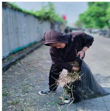
Gambar 4. Pengumpulan Sampah Sekitar Sungai

Setelah kita melaksanakan upacara dalam rangka pembukaan serta pemberian arahan untuk melaksanakan kegiatan ini, masing-masing dari kita menuju ke zona yang telah ditentukan untuk membersihkan tempat tersebut seperti yang telah diarahkan oleh pengarah yang bertanggung jawab atas kegiatan ini. Disini terdapat banyak rumput liar disekitar pinggiran sungai yang dilalui oleh masyarakat setempat sehingga membahayakan serta mengganggu aktivitas bagi pengguna jalan tersebut, dengan ini Ketika sudah dibersihkan jalan akan lebih terlihat dan memberi kenyamanan kepada pengguna jalan disekitar sungai.