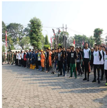
Gambar 2. Kegiatan Upacara bersama beberapa element Dinas, Masyarakat, dan Mahasiswa

Sebelum bergabung Bersama beberapa unit dan elemen Masyarakat, para mahasiswa dikumpulkan terlebih dahulu melalui apel pagi di halaman kampus untuk diberikan arahan dan penjelasan oleh bapak/ibu dosen terkait kegiatan yang akan diselenggarakan oleh banyak peserta dari berbagai elemen instansi dan masyarakat dalam mewujudkan lingkungan bersih dan nyaman. Karena dengan pelaksanaan apel pagi ini para mahasiswa dapat memahami bagaimana kegiatan yang akan dijalani pada hari itu juga setelah diadakannya apel pagi tersebut.