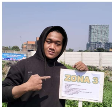
Gambar 8. Setelah Kegiatan Lingkungan Bersih

Setelah kita mencabuti dan membersihkan halaman kampus, kita mengumpulkan hasil kerja kita untuk dipindahkan ke gerobak sampah dan akan dikumpulkan di pengumpulan terakhir untuk di pisah antara sampah organic dan nonorganic agar mudah diuraikan. Para dosen juga selain mengawasi para mahasiswa agar semuanya berjalan dengan lancar beliau juga membantu ikut membersihkan dan membantu para mahasiswa guna menjaga kekompakan dan tetap hangat dalam suasana kerja bakti yang ramai dan menyenangkan