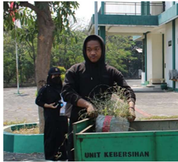
Gambar 7. Pengumpulan Rumput Liar Sekitar Kampus

Pengumpulan dahan ranting telah selesai, kita berlanjut pindah Lokasi di halaman kampus yang terlihat sudah banyaak ditumbuhi rumput liar yang sudah menyebar dan tumbuh tinggi. Dari situ kita berkumpul dari seluruh kelompok zona mahasiswa untuk membersihkan daerah halaman kampus agar terlihat bersih, dan nyaman untuk dilihat. Dengan terik matahari yang makin terang, para mahasiswa tetap semangat dan antusias untuk kerjsama dalam menjaga kebersihan kampus mereka juga