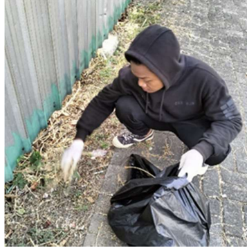
Gambar 3. Pelaksanaan Kegiatan Bersih-Bersih Sekitar Sungai

peserta yang turut andil untuk menjalankan kegiatan ini, karena dengan terlaksananya upacara ini akan disampaikan bagaimana system, teknis, dan bagian yang akan di eksekusi dengan penataan sedemikian rupa dari pemeta konsep kegiatan ini yang disampaikan pada upacara tersebut agar kegiatan berjalan dengan lancar, terstruktur dengan baik, meminimalisir hal-hal yang tidak diinginkan, dan berjalan dengan maksimal