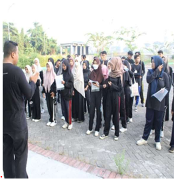
Gambar 1. Kegiatan Apel pagi sebelum bergabung bersama para Instansi dan Masyarakat

Tujuan dari terlaksananya kegiatan ini secara umum sudah sangat memuaskan, jika dilihat dari hasil kegiatan bersih-bersih yang diselenggarakan oleh Dinas, Masyarakat, Mahasiswa dan beberapa instansi lainnya dapat disimpulkan bahwa tujuan lingkungan bersih ini sudah tercapai.