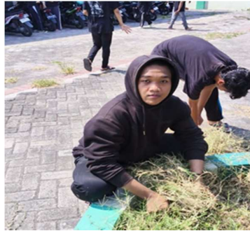
Gambar 6. Pencabutan Rumput Sekitar Kampus

Kita berpindah ke pekerjaan lain namun masih dalam agenda kebersihan, yakni kita memilah dahan ranting yang dimana ranting tersebut sudah bercabang Panjang ke samping pohon sehingga dapat mengganggu aktivitas pengguna jalan disamping sungai serta meminimalisir jatuhnya pohon akibat tidak seimbangnya beban pohon. Disitu kami juga memilah dahan ranting yang sudah mati atau rapuh, agar pohon agar tetap sehat dan terawatt dengan baik. Sekaligus kita kumpulkan dahan yang sudah dipotong tadi ke tempat pengumpulan dahan ranting yang sudah dibedakan sendiri dari kumpulan tempat sampah yang lain agar mudah diuraikan seperti dibakar atau dll.