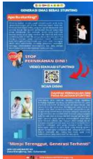
Gambar 1. Banner interaktif

Pada tahap implementasi, sosialisasi dilakukan selama pertemuan desa, memperkenalkan cara memindai QR Code untuk mengakses video secara mandiri. Observasi lapangan mencatat rata-rata 5-10 warga memindai QR per hari. Evaluasi dilakukan melalui komentar di platform YouTube dan mengisi formulir post test kepada masyarakat yang telah menonton video. Hal tersebut dilakukan guna mengetahui perbedaan pengetahuan ataupun meningkatkan pemahaman terkait isu pernikahan dini dan stunting. Hasil post test menunjukkan perbedaan peningkatan yang signifikan, antara sebelum menonton dan setelah menonton video. Sebelum menonton, sekitar 40% responden mengetahui keterkaitan antara stunting dan pernikahan dini; setelah menonton, angka tersebut meningkat menjadi sekitar 80%.