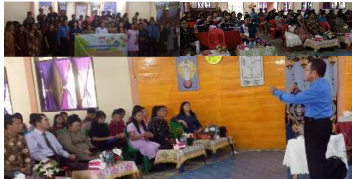
Gambar 1. Lokasi Pelaksanaan BK Klasikal Desa Dahadano Botombawo Kecamatan Hiliserangkai Kabupaten Nias Sumatera Utara

Layanan bimbingan konseling klasikal pengabdian kepada masyarakat (PKM) telah terlaksana dengan baik. Lokasinya adalah Desa Dahadano Botombawo Kecamatan Hiliserangkai Kabupaten Nias Provinsi Sumatera Utara. Sasaran layanan adalah persekutuan pemuda dan remaja GPT, jumlah semua peserta layan adalah 75 orang. Lokasi ini terletak di Kabupaten Nias.