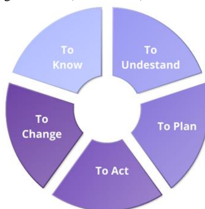
Gambar 1. Tahapan PAR (Participatory Action Research)

Metode yang digunakan pada program pengabdian masyarakat untuk sosialisasi dan pelatihan penggunaan internet sehat ini dengan pendekatan PAR ( Participatory Action Research ). Fokus pendekatan PAR ini berorientasi kepada 3 elemen yaitu pemenuhan kebutuhan, penyelesaian masalah praktis dan pengembangan ilmu pengetahuan dan keberagaman di masyarakat (Mukrimaa et al., 2016). Adapun tahap pendekatan PAR sebagai berikut (Yasir, 2023) :