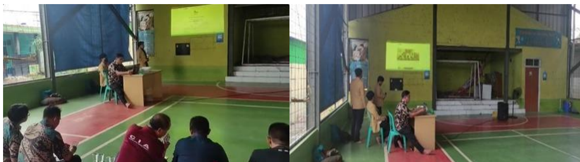
Gambar 4. Pemaparan Program Kerja

Pada tahap merupakan acara inti dari rencana kerja yang telah disusun sebelumnya, melalui kegiatan sosialisasi dan pelatihan langsung kepada kelompok sasaran yaitu para remaja RW 11 Wanajaya beserta pendampingnya dari keluarga maupun komunitas sekitar. Kegiatan berlangsung interaktif dengan metode ceramah dialogis serta simulasi praktis agar peserta dapat memahami materi secara optimal sekaligus menerapkan prinsip-prinsip penggunaan internet sehat dalam kehidupan sehari-hari.