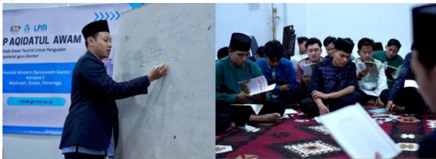
Gambar 2. Pelaksanaan Workshop Penguatan Aqidah Berbasis Kitab Aqidatul 'Awam

Inti dari kegiatan ini yaitu workshop dan pelatihan penguatan aqidah, di mana peserta mengikuti Workshop Penguatan Ilmu Aqidah berbasis kitab Aqidatul 'Awam. Pembahasan difokuskan pada tiga ruang lingkup utama yang mencakup Ilahiyat melalui pendalaman mengenai sifat-sifat wajib, mustahil, dan jaiz bagi Allah SWT, kemudian Nubuwwat sebagai penguatan pemahaman mengenai sifat para Rasul, tugas mereka, serta kitab-kitab yang dibawa, dan Sam'iyat yang berisi diskusi mengenai perkara gaib yang wajib diimani seperti alam barzakh, hari kiamat, hingga surga dan neraka. (al-Bantani 1996) Selain materi teologis tersebut, peserta juga mendapatkan pelatihan pedagogis kontekstual serta ruang diskusi untuk membedah isu-isu aqidah kontemporer. Seluruh kegiatan dilaksanakan secara interaktif melalui pemaparan materi, diskusi kelompok, studi kasus, dan simulasi pengajaran guna mendorong partisipasi aktif peserta. Proses ini diharapkan dapat memperkuat pemahaman konseptual sekaligus mengasah keterampilan pedagogis guru dalam menyampaikan materi aqidah secara komprehensif kepada peserta didik.