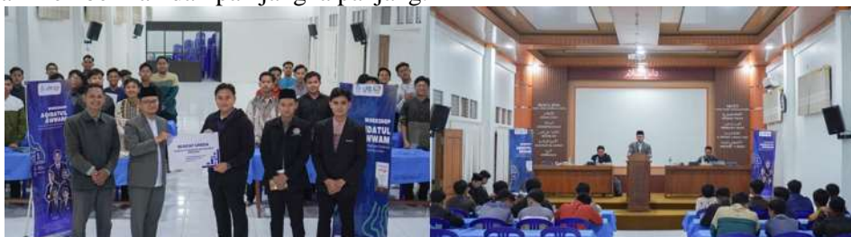
Gambar 3. Kegiatan Penutupan Program Pengabdian

Kegiatan pengabdian ditutup dengan sesi penutupan yang dihadiri oleh mitra yaitu pihak pembimbing Dewan Mahasiswa (DEMA) Gontor Kampus 2 dan peserta. Pada sesi ini dilakukan refleksi bersama terkait pelaksanaan program, penyampaian kesan dan pesan dari peserta, serta penegasan rencana keberlanjutan melalui forum kajian aqidah dan pembentukan Tim Inti Guru Aqidah. Sesi penutupan menjadi momentum penguatan komitmen bersama agar hasil kegiatan pengabdian dapat terus berlanjut dan memberikan dampak jangka panjang.