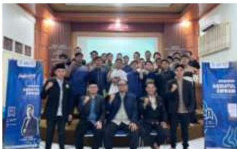
Gambar 1. Kegiatan Pembukaan Program Pengabdian Bersama Mitra

Dalam sambutannya, Wakil Direktur KMI menyatakan dukungan penuh terhadap kegiatan ini karena dinilai sangat selaras dengan visi dan program kerja KMI, khususnya dalam meningkatkan kualitas Kegiatan Belajar Mengajar (KBM). Program penguatan aqidah ini dianggap sebagai pendukung strategis bagi kurikulum internal, terutama bagi para santri baru. Pihak pondok menekankan bahwa pemahaman aqidah yang kokoh merupakan pondasi paling mendasar bagi santri baru sebelum mereka mendalami disiplin ilmu lainnya.