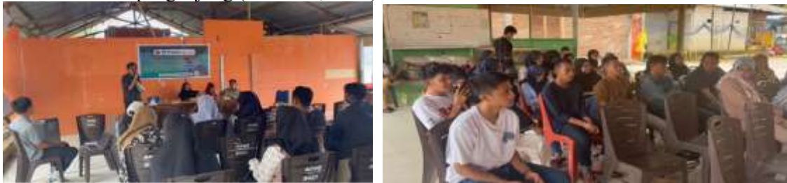
Gambar 3. Pelatihan Kepada Karang Taruna

Pendampingan dalam program “Pemberdayaan Karang Taruna sebagai Digital Marketer: Strategi Branding Wisata Pulau Karampuang melalui Instagram, TikTok, dan Website” dilakukan secara langsung di lapangan maupun melalui bimbingan teknis berkala. Tim pelaksana PKM tidak hanya memberikan materi, tetapi juga melakukan pendampingan praktis berupa arahan, koreksi, dan masukan atas konten-konten yang diproduksi Karang Taruna. Hasil nyata dari pendampingan ini adalah terbentuknya tiga kanal digital resmi sebagai sarana promosi wisata Pulau Karampuang, yaitu: