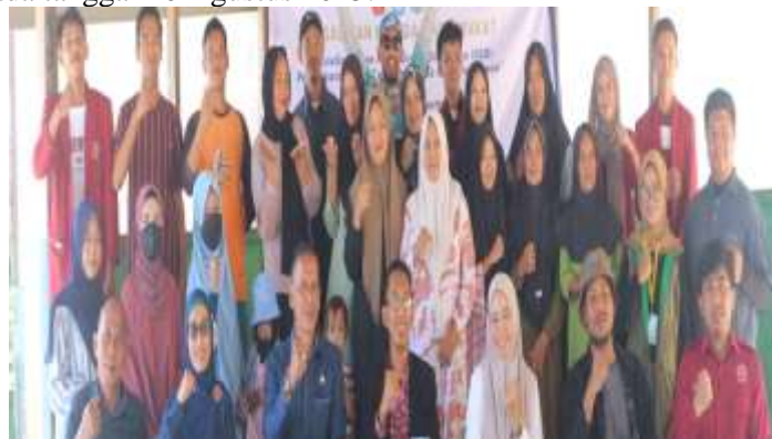
Gambar 2. Sosialisasi Kegiatan PKM

Kegiatan sosialisasi dilakukan pada tanggal 7 Juli 2025 di Aula desa Pulau Karampuang. Kegiatan sosialisasi dihadiri ibu desa dan karang taruna karampuang. Kegiatan ini menjadi titik awal penting dalam upaya membangun kolaborasi antara tim pelaksana PKM Universitas Muhammadiyah Mamuju. Kegiatan sekaligus menetapkan jadwal pelatihan lanjutan yang akan di fokuskan pada peningkatan kapasitas karang taruna dalam bidang promosi digital, pengelolaan wisata dan penguatan Lembaga. Pada kegiatan ini tim peneliti Bersama ketua karang taruna melihat beberapa objek wisata di Pulau karampuang yang akan dijadikan daya Tarik untuk menarik wisatawan berkunjung ke pulau karampuang. Secara umum, pelaksanaan sosialisasi ini memberikan dampak awal yang sangat positif. Masyarakat mulai menyadari bahwa Pulau Karampuang memiliki potensi wisata yang besar apabila dikelola secara terpadu. Selain itu, keterlibatan Karang Taruna sebagai generasi muda desa dinilai sebagai langkah strategis dalam membangun pariwisata berkelanjutan, karena mereka memiliki energi, kreativitas, serta kemampuan adaptasi terhadap perkembangan teknologi informasi. Dengan tercapainya kesepakatan dan terbentuknya tim inti, maka kegiatan Pelatihan strategi branding di Pulau Karampuang akan dilaksanakan pada tanggal 10 Agustus 2025.