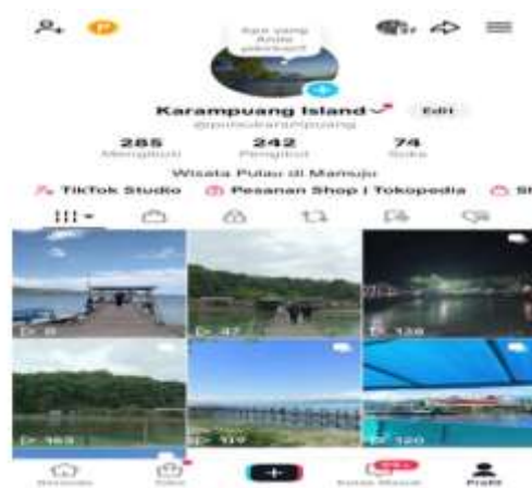
Gambar 5. Konten Tiktok

TikTok wisata karampung digunakan untuk memproduksi foto dan video singkat (15–60 detik) yang menampilkan keindahan alam, aktivitas wisata, hingga tips perjalanan ke Pulau Karampung. TikTok menjadi sarana efektif untuk membentuk preferensi wisata generasi Z dan milenial melalui konten yang inspiratif dan informatif. Program pelatihan kreator konten yang dilakukan oleh pemerintah dan komunitas lokal juga terbukti meningkatkan kualitas konten dan memperluas jangkauan promosi (Tarji, 2025).