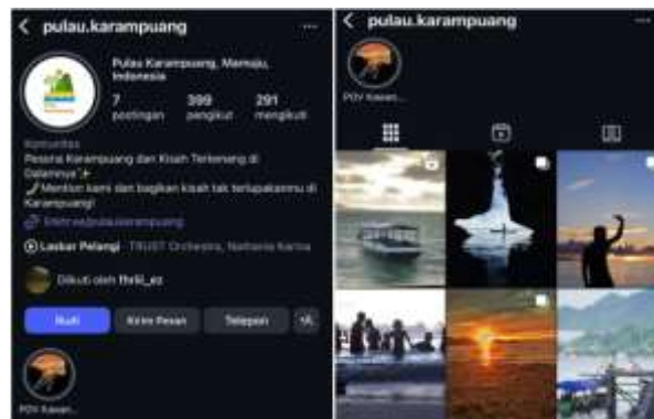
Gambar 4. Konten Instagram Pulau Karampung