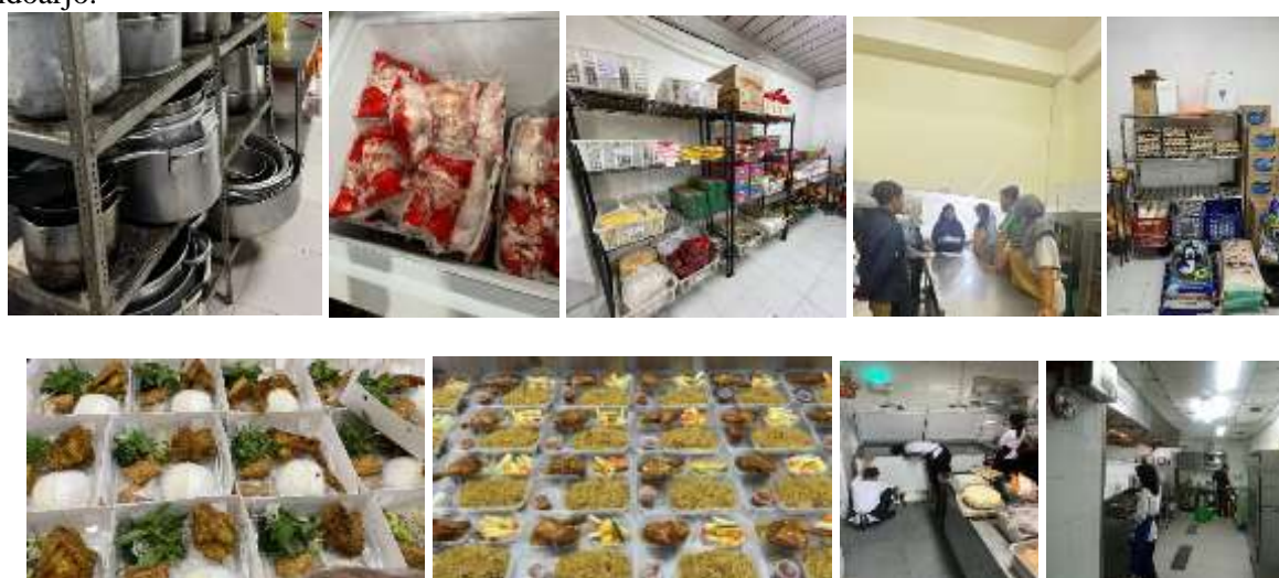
Gambar 1. Kondisi eksisting area dapur dan lingkungan produksi Kossuha Catering

Kossuha Catering Sidoarjo merupakan unit usaha boga yang memiliki potensi besar dengan volume produksi yang cukup aktif setiap harinya. Namun, dalam pengamatannya, pengelolaan ruang produksi masih terlihat kurang tertata secara sistematis, di mana pemanfaatan area kerja dan alur distribusi bahan baku belum sepenuhnya sejalan dengan prinsip tata letak dapur profesional. Selain itu, penerapan standar hygiene personel dan pengorganisasian inventaris alat masih memerlukan standarisasi yang lebih ketat guna meminimalisir risiko kontaminasi serta meningkatkan efisiensi kerja. Kondisi inilah yang menjadi latar belakang pentingnya dilakukan pendampingan praktik mengenai standar produksi yang lebih terstruktur dan higienis. Sebagai gambaran visual mengenai situasi di lapangan sebelum dilakukannya pembenahan, berikut adalah dokumentasi kondisi area dapur di Kossuha Catering Sidoarjo.