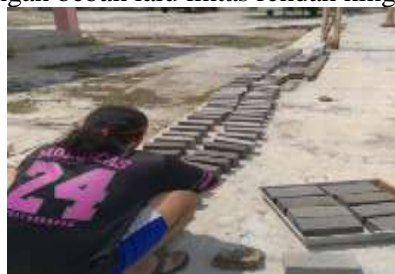
Gambar 9. Penjemuran Paving Block

Produksi Paving Block, Setelah peserta mendapatkan materi dan memahami pembuatan paving block bersama mitra, melaksanakan produksi sejumlah paving block berbasis limbah Styrofoam per meter persegi menghasilkan 90 buah paving block dengan ukuran 21x10x8 cm kegiatan produksi ini memberikan keterampilan dan kerapihan hasil produksi, paving block yang sudah dicetak dilakukan perawatan dengan menempatkan yang aman serta dapat di jemur untuk membantu percepatan pengeringan. Produk yang telah dihasilkan dapat diuji secara sederhana dari segi kekuatan tekan dan ketahanan awal, Hasil uji lapangan menunjukkan paving block dapat digunakan sebagai perkerasan ringan di area jalan lingkungan dengan beban lalu lintas rendah hingga sedang (Di et al., 2024).