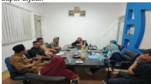
Gambar 10. Diskusi Pembentukan Unit Skala Kecil Pengolahan Limbah Styrofoam

Pendampingan Mitra, dilakukan dimulai pengelolaan bahan baku limbah styrofoam, pengumpulan, pemilahan, hingga pengolahan. Kemudian Mitra diberikan modul pelatihan dan panduan sederhana sehingga dapat melanjutkan produksi secara mandiri. Tidak hanya itu mitra juga diberikan SOP penggunaan mesin pencacah. Pendampingan terhadap mitra juga dalam pembentukan unit khusus unit pengolahan limbah Styrofoam skala kecil menjadi pusat inovasi dan produksi paving block berbasis Styrofoam produk material yang dapat dijual.