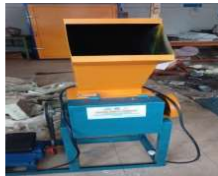
Gambar 5. Alat Pencacah Styrofoam

Cara membuat paving block dimulai mempersiapkan bahan, mencacah Styrofoam lewat alat pencacah, mencampur adukan antara Styrofoam, dengan abu batu, pasir dan semen, olesi cetakan dengan oli,