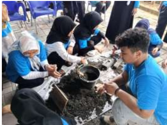
Gambar 6. Pembuatan Paving Block

selanjutnya masukan adukan campur yang sudah homogen tadi ke dalam cetakan, setelah itu dimampatkan, balikan cetakan tersebut di atas alas dan dijemur minimal 7 hari.