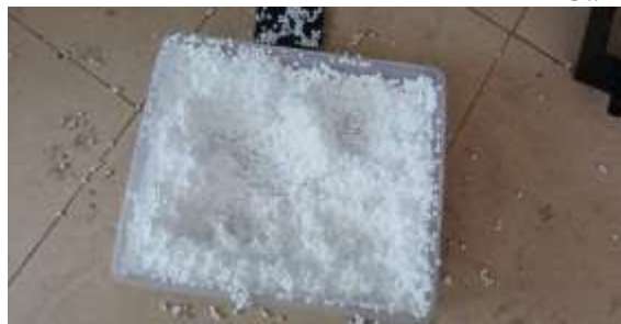
Gambar 3. Styrofoam

Alat-alat yang digunakan dalam kegiatan ini adalah sekop kecil, pacul, alat pencacah, ember, cetakan paving dengan uji tekan 19 mpa.