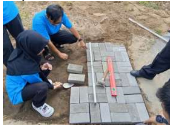
Gambar 7. Paving Block diterapkan di jalan