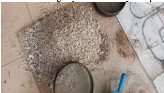
Gambar 1. Abu Batu