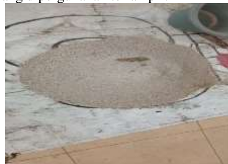
Gambar 2. Pasir