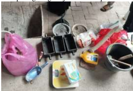
Gambar 4. Alat yang digunakan dalam paving block

Alat-alat yang digunakan dalam kegiatan ini adalah sekop kecil, pacul, alat pencacah, ember, cetakan paving dengan uji tekan 19 mpa.