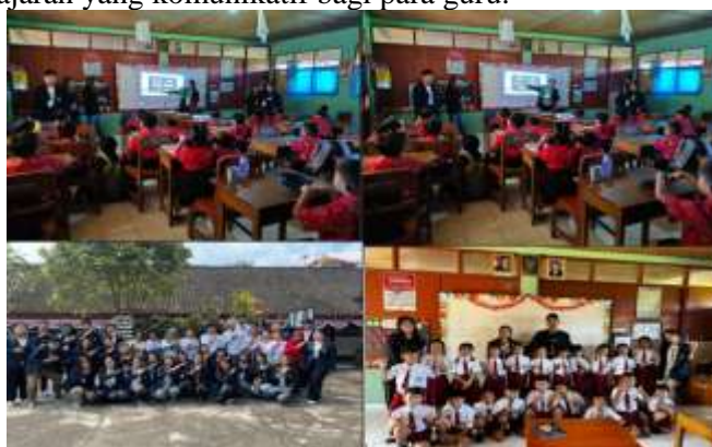
Gambar 3. Pendampingan Sistem Pembelajaran di SDN 1 Meliling

Peningkatan mutu pembelajaran dilakukan dengan pendampingan pada sistem pembelajaran dari sistem yang monoton diadaptasikan dengan Implementasi Teknologi yang lebih menarik dengan fitur pembelajaran yang atraktif. Sistem ini mampu menstimulus siswa untuk meningkatkan kemampuan dan menjadi media pembelajaran yang komunikatif bagi para guru.