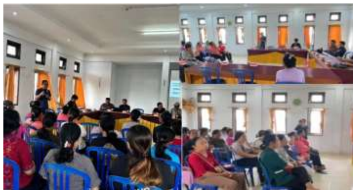
Gambar 2. Kegiatan Pendampingan Manajemen Usaha BUMDesa Jagaddita