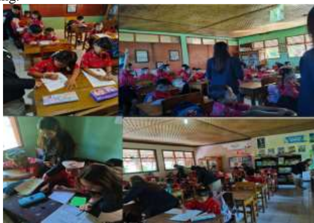
Gambar 4. Pendampingan Calistung Siswa SDN 1 Meliling

Kemampuan calistung beberapa siswa anak-anak SD Negeri Meliling masih rendah. Program PMM yang dilakukan untuk meningkatkan kemampuan Calistung adalah dengan melakukan pembelajaran tambahan dengan media digital untuk merangsang dan menumbuhkan rasa tertarik untuk belajar. Hasilnya adalah terdapat peningkatan yang signifikan kemampuan membaca dan berhitung anak-anak SDN 1 Meliling.