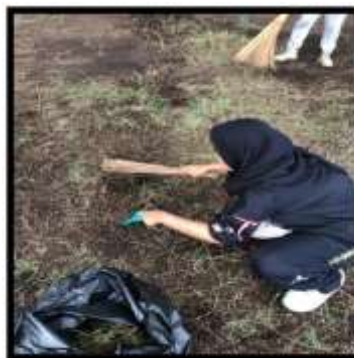
Gambar 3. Kegiatan Menyapu Rumput yang Sudah diCabuti

Menanam tanaman toga juga perlu belajar lebih banyak lagi, karena untuk menjaganya agar tanaman tersebut tetap tumbuh itu memiliki beberapa cara. Dan digambar tersebut adalah sedang melakukan penataan tanaman agar terlihat rapi, setiap kelompok juga melakukan denah untuk berbagai macam tanaman untuk ditanam dengan rapi dan tersusun tidak hanya tanaman toga tetapi juga tanaman lain. Dan tanaman toga tersebut meliputi cabai, tomat, dan juga terong. Karena ini dengan adanya kegiatan penanaman tersebut juga untuk kelestarian lingkungan taman di kampus, tujuan penataan tanaman toga sudah terlaksana dan perawatan terus dilakukan agar tetap terjaga (Saputra et al. , 2023).