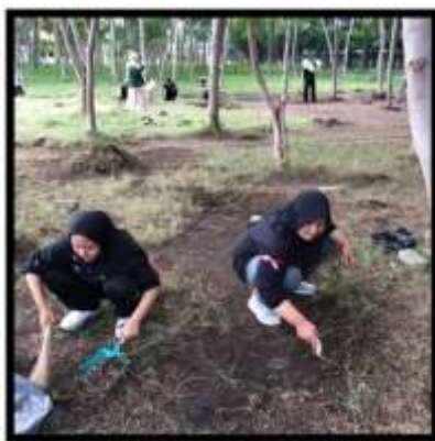
Gambar 1. Kegiatan Membersihkan Akar Liar

Proses pembersihan taman dan lingkungan sekitar harus tetap dijaga kelestariannya, agar tetap terjaga kelestarian taman. Saling gotong royong sesama yang lain agar pekerjaannya berjalan dengan baik, dan memiliki progres kedepannya agar tertata dengan rapi untuk kegiatan bersih-bersih taman di kampus, harapan kedepannya tetap memiliki kesadaran yang penuh, agar progress perawatan taman kampus menjadi lebih baik dan mencapai generasi yang peduli lingkungan.