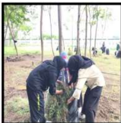
Gambar 4. Kegiatan Membuang Rumput Ke Kantong Sampah

Kegiatan menjaga kelestarian taman di area kampus dilakukan dengan gotong royong dalam melakukan keindahan taman yang telah di bagi, Nilai kerja tim dalam mencapai tujuan bersama ditekankan kepada para siswa. Selain itu, partisipasi dalam kegiatan kelompok ini membantu menumbuhkan rasa kedekatan dan kekeluargaan. Serta memperkuat ikatan pertemanan, dari gambar tersebut para mahasiswa sedang mencabuti dan mengumpulkan rumput agar terlihat rapi. Karena kebersihan itu juga sangat penting untuk diri kita sendiri maka dari itu, dalam kegiatan tersebut juga sangat penting untuk saling mengingatkan antar sesama. Tujuan pembersihan rumput yang panjang dan terlalu rimbun sudah selesai, tetapi jika beberapa minggu ke depan rumput mulai panjang akan dilakukan pencabutan kembali (Lubis et al. , 2024)