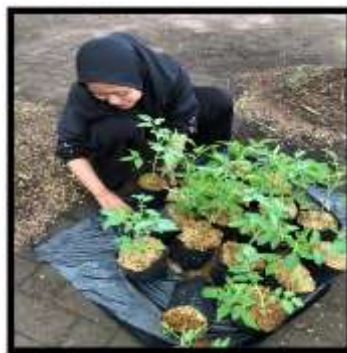
Gambar 2. Kegiatan Menata Tanaman Toga

Menanam tanaman toga juga perlu belajar lebih banyak lagi, karena untuk menjaganya agar tanaman tersebut tetap tumbuh itu memiliki beberapa cara. Dan digambar tersebut adalah sedang melakukan penataan tanaman agar terlihat rapi, setiap kelompok juga melakukan denah untuk berbagai macam tanaman untuk ditanam dengan rapi dan tersusun tidak hanya tanaman toga tetapi juga tanaman lain. Dan tanaman toga tersebut meliputi cabai, tomat, dan juga terong. Karena ini dengan adanya kegiatan penanaman tersebut juga untuk kelestarian lingkungan taman di kampus, tujuan penataan tanaman toga sudah terlaksana dan perawatan terus dilakukan agar tetap terjaga (Saputra et al. , 2023).