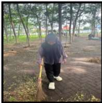
Gambar 7. Kegiatan Menyapu Runtuhan Daun

Menjaga kelestarian dan kebersihan bersama juga motivasi untuk generasi muda, agar selalu mengingat tentang kebersihan lingkungan sekitar. Tidak hanya di sekitar taman tapi juga sekitar lingkungan kampus. Gambar tersebut adalah pembersihan daun yang runtuh, setiap ketua diberbagai kelompok memiliki cara tersendiri untuk membuat kekompakan anggotanya. Menyapu sampah dan daun-daun yang runtuh dipohon dilakukan setiap pelaksanaan kegiatan, dan tujuan tersebut tercapai karena sangat dianjurkan untuk menyapu dan membersihkan sampah daun-daun yang berjatuhan dan sampah yang lainnya di taman setiap mulai dan akhir kegiatan (Masfufah et al. , 2025)