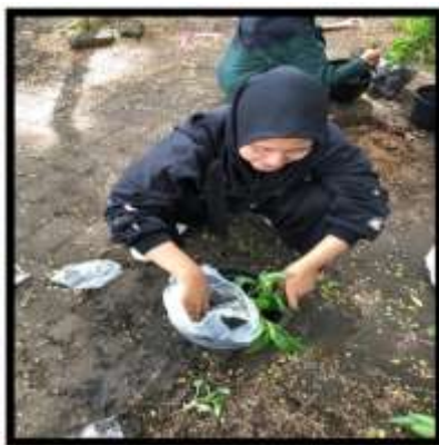
Gambar 5. Kegiatan Menanam Cabe

Hasil dari pencabutan rumput itu dikumpulkan dan dijadikan satu ke dalam kantong yang besar. Agar sekitarnya terlihat rapi dari sebelumnya, dari kegiatan tersebut juga mengajarkan kita bagaimana cara menjaga lingkungan sekeliling dari sampah. Maka dari itu, kegiatan bersih-bersih taman itu dianggap sebagai pembelajaran. Dan untuk membangun generasi muda di kampus menjadi lebih peduli terhadap lingkungan sekitarnya. Kebersihan itu berasal dari diri sendiri dan juga kebiasaan, maka dari itu kegiatan bersih-bersih taman juga untuk menyadarkan kita akan pentingnya lingkungan yang bersih dan nyaman. Tujuan tersebut sudah terlaksanakan dan ketika kegiatan pencabutan rumput akan dilaksanakan kembali maka, kegiatan pembuangan rumput ke kantong sampah juga akan dilakukan lagi (Ahyar et al. , 2025).