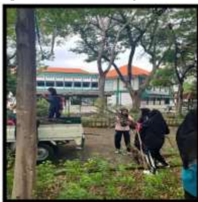
Gambar 8. Kegiatan Mengangkat Kayu Pohon ke Dalam Box Mobil

Menjaga kelestarian dan kebersihan bersama juga motivasi untuk generasi muda, agar selalu mengingat tentang kebersihan lingkungan sekitar. Tidak hanya di sekitar taman tapi juga sekitar lingkungan kampus. Gambar tersebut adalah pembersihan daun yang runtuh, setiap ketua diberbagai kelompok memiliki cara tersendiri untuk membuat kekompakan anggotanya. Menyapu sampah dan daun-daun yang runtuh dipohon dilakukan setiap pelaksanaan kegiatan, dan tujuan tersebut tercapai karena sangat dianjurkan untuk menyapu dan membersihkan sampah daun-daun yang berjatuhan dan sampah yang lainnya di taman setiap mulai dan akhir kegiatan (Masfufah et al. , 2025)