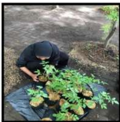
Gambar 6. Kegiatan Menanam Tomat

Penanaman cabe dilakukan secara bersama juga, dan terus merawatnya dengan baik. Dan salah satu manfaat penghijauan adalah menciptakan keadaan lingkungan yang sejuk. Kita juga belajar bagaimana cara merawat tanaman pangan dan juga tanaman hias, Karena di taman tersebut memiliki 2 macam tanaman. Selain merawat tanaman lingkungan sekitar taman juga harus diperhatikan kebersihannya dari sampah-sampah plastik dan lain lainnya. Dan kegiatan ini harus dilakukan secara gotong royong, karena taman yang telah ditentukan tempatnya itu juga memiliki kelompok. Tujuan penanaman tumbuhan cabe sudah tercapai maka dari itu merawat secara bersama itu sangat dibutuhkan dalam kegiatan berkelompok (Ummah et al. , 2024).