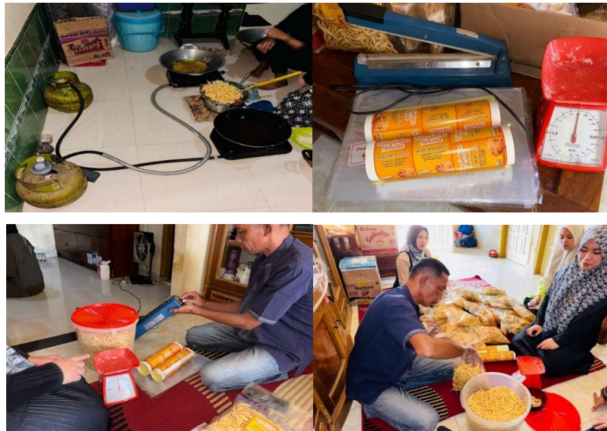
Gambar 2. Bentuk Kemasan, Ukuran Produk dan Peralatan Teknologi yang di miliki oleh Mitra

Permasalahan ketiga menyangkut aspek produksi. Proses produksi Telur Gabus Almetta masih dilakukan secara manual mulai dari pencampuran adonan, pencetakan sampai penggorengan, sehingga kapasitas produksi terbatas dan kualitas produk belum sepenuhnya konsisten antarbatches. Peralatan pengemasan yang digunakan juga masih sederhana sehingga kemasan kurang rapat dan daya tahan produk relatif pendek. Temuan ini sejalan dengan berbagai laporan pengabdian yang menunjukkan bahwa minimnya peralatan produksi modern menjadi salah satu penyebab rendahnya efisiensi dan kualitas produk UMKM pangan (Sulastri et al., 2021; Ilhami et al., 2024). Ketiadaan peralatan seperti continuous band sealer dan alat bantu produksi lainnya menghambat peningkatan kapasitas produksi serta pemenuhan standar higienitas dan standar kemasan yang dipersyaratkan ketika akan menembus pasar ritel modern.