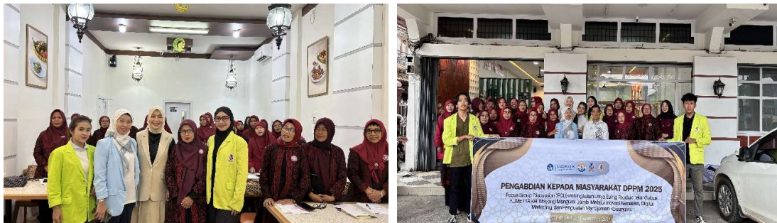
Gambar 3. Pelaksanaan Focus Group Discussion (FGD) bersama Mitra

Tahap ini merupakan inti kegiatan pengabdian, meliputi pelatihan teknis, praktik lapangan, dan fasilitasi peralatan. Sebelum pelatihan dan pendampingan, tim PKM menyelenggarakan Focus Group Discussion (FGD).