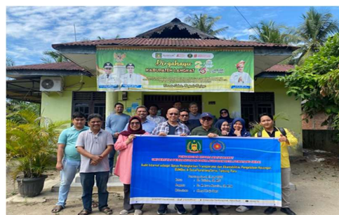
Gambar 2. Dokumentasi Foto Bersama

Salah satu capaian penting dari kegiatan pengabdian ini adalah terlaksananya audit internal perdana BUMDes dengan pendampingan langsung dari tim pelaksana. Audit dilakukan terhadap transaksi keuangan selama enam bulan terakhir dan menghasilkan laporan temuan beserta rekomendasi perbaikan. Laporan audit tersebut kemudian dipresentasikan secara terbuka dalam forum musyawarah desa yang melibatkan pemerintah desa, Badan Permusyawaratan Desa (BPD), dan perwakilan masyarakat. Pelaksanaan audit internal ini menjadi tonggak awal terbentuknya budaya transparansi dan pertanggungjawaban terbuka di lingkungan BUMDes Desa Pematang Serai.