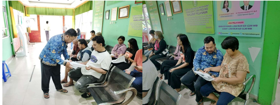
Gambar 2. Sesi diskusi

Pelaksanaan kegiatan diawali dengan pemberian penyuluhan edukatif mengenai skizofrenia dan pencegahan kekambuhan yang disampaikan oleh perawat Rumah Sakit Jiwa Provinsi Kalimantan Barat dengan pendampingan dosen keperawatan. Materi edukasi mencakup pengenalan skizofrenia, tanda dan gejala kekambuhan, faktor pencetus kekambuhan, pentingnya kepatuhan minum obat, serta peran keluarga dalam menciptakan lingkungan yang aman dan kondusif bagi pasien. Media leaflet digunakan sebagai alat bantu edukasi untuk memudahkan keluarga memahami materi yang disampaikan. Selama proses penyuluhan, peserta tampak mengikuti kegiatan dengan penuh perhatian dan menunjukkan ketertarikan terhadap materi yang diberikan.