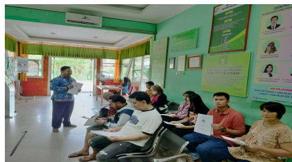
Gambar 1. Edukasi pengenalan skizofrenia dan pencegahan kekambuhan

Kegiatan pengabdian kepada masyarakat dengan judul “Pemberdayaan Keluarga sebagai Upaya Pencegahan Kekambuhan Penderita Skizofrenia” dilaksanakan pada tanggal 17 November 2025 di Poli Rawat Jalan Rumah Sakit Jiwa Provinsi Kalimantan Barat. Kegiatan ini diikuti oleh 20 keluarga yang berperan sebagai pengasuh utama (caregiver) penderita skizofrenia yang sedang menjalani pengobatan rawat jalan.