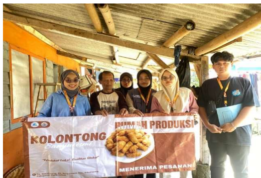
Gambar 4. Pendampingan Administrasi dan Pembuatan Logo, Merk dan Kemasan

Hasil diskusi lapangan di Desa Banyuresmi mengungkap bahwa kekurangan digitalisasi, legalitas, dan branding pada UMKM bukan semata masalah teknis, melainkan juga berakar pada karakteristik sosial pelaku usaha. Sebanyak 90% pelaku UMKM berusia di atas 45 tahun menghadapi kesulitan adaptasi terhadap teknologi modern, seperti platform media sosial dan sistem OSS untuk NIB. Ketakutan terhadap kompleksitas teknologi dan kurangnya literasi digital menjadi penghalang utama, konsisten dengan temuan bahwa usia lanjut dan rendahnya keterampilan digital menghambat adopsi teknologi UMKM pedesaan hingga 65% (Resna Napitu et al, 2025). Studi serupa menunjukkan pelaku UMKM lansia memerlukan pendekatan pelatihan berbasis komunitas untuk mengatasi resistensi teknologi (Pemerintah Desa Adi Luhur, 2025).