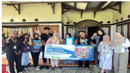
Gambar 3. Pendampingan Administrasi dan Pembuatan Logo, Merk dan Kemasan