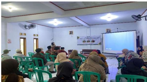
Gambar 1. Kegiatan Seminar UMKM

Pendekatan terintegrasi ini sejalan dengan studi pengabdian masyarakat yang membuktikan kombinasi rebranding, legalisasi, dan digitalisasi meningkatkan omzet UMKM hingga 40-60% dalam 3 bulan pertama (Athasani et al., 2025). Pendampingan legalitas melalui OSS terbukti efektif memberikan akses pasar formal dan pembiayaan bank (Nurul Zairina & Zaenal Wafa, 2023). Praktik langsung branding dan digital marketing memperkuat daya saing UMKM pedesaan, konsisten dengan temuan bahwa pelatihan berbasis komunitas meningkatkan adopsi teknologi 75% (Dzikri Kurniawan et al., 2023). Berikut dokumentasi kegiatan pengabdian masyarakat yang telah dilaksanakan