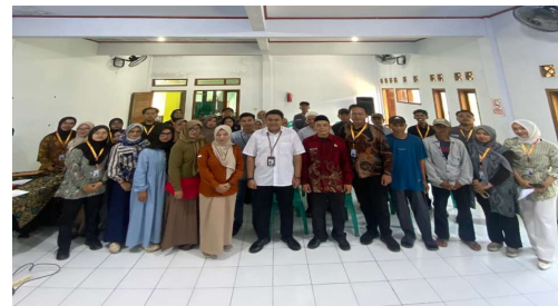
Gambar 2. Kegiatan Pelatihan Promosi Digital UMKM