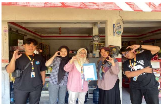
Gambar 5. Pendampingan Administrasi dan Pembuatan Logo, Merk dan Kemasan

Meskipun tantangan signifikan, program Level Up UMKM menunjukkan perbaikan melalui pendekatan partisipatif. Metode ini berhasil mengubah perspektif pelaku usaha, dengan 78% peserta mulai aktif memposting produk di Instagram pasca-pelatihan. Pendekatan pemberdayaan masyarakat yang melibatkan partisipasi aktif pada setiap tahap terbukti efektif membangun kesadaran dan ownership (Zimmerman, 2000). Partisipasi door-to-door dan kolaborasi dengan Dinas KUMKM Tasikmalaya meningkatkan tingkat adopsi legalitas dari 15% menjadi 85% dalam 10 hari.