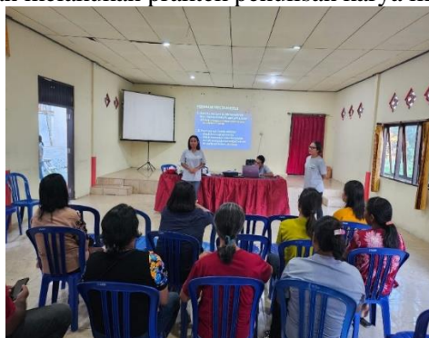
Gambar 1. Kegiatan Pengabdian Hari Pertama