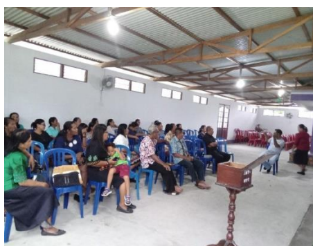
Gambar 2. Kegiatan Pengabdian Hari Kedua