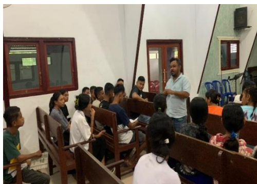
Gambar 3. Kegiatan Pengabdian Hari Ketiga