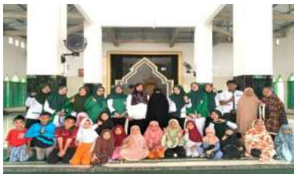
Gambar 1. Kegiatan Penyuluhan

perkenalan, kemudian dilanjutkan dengan perbincangan mulai dari apa itu diabetes dan hipertensi, cara mengatasinya, teknik menghilangkan stres, senam kaki, hingga jalan cepat bagi masyarakat yang menghadapi penyakit tersebut. Para lansia sangat antusias dengan informasi yang diberikan, karena bisa dibilang begitu. mendengarkan, mengajukan banyak pertanyaan tentang bagian-bagian yang belum mereka pahami. Semua orang yang terlibat sangat menyukainya, dan semua orang sangat antusias, jadi keseluruhan acara berjalan lancar tanpa hambatan