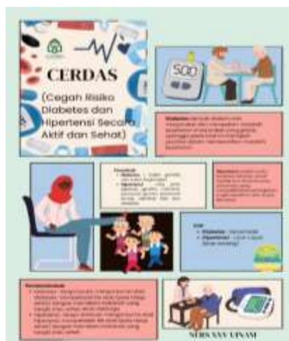
Gambar 2. Poster Kegiatan

Kegiatan penyuluhan dengan tema CERDAS (Cegah Risiko Diabetes dan Hipertensi Secara Aktif dan Sehat) yang diadakan di RW 1 Dusun Pa'bundukang berhasil meningkatkan pengetahuan serta partisipasi masyarakat, terutama pasien lansia. Dari sini, terlihat bagaimana peserta begitu antusias, mereka bukan cuma mendengarkan tapi juga aktif bertanya dan mengikuti sesi demonstrasi terapi senam kaki dan jalan cepat (Cao et al., 2019; Ramadhan et al., 2025; Rasdiyanah, 2023). Respon yang cukup positif ini sebenarnya menunjukkan bahwa pendekatan penyuluhan kesehatan yang berbasis komunitas masih efektif untuk menyebarkan edukasi ke masyarakat. Hal ini sejalan dengan temuan (Muthahharah et al., 2024; Rachmawati et al., 2022; Suwandi et al., 2025), yang menemukan edukasi kesehatan efektif dapat memperbaiki pemahaman dan cara pencegahan untuk penyakit tidak menular seperti hipertensi dan diabetes, sehingga kegiatan serupa layak terus dilanjutkan.