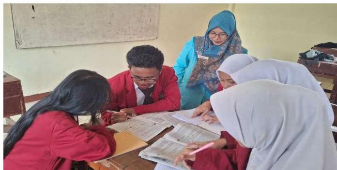
Gambar 3. Proses pendampingan guru di kelas

Hasil pendampingan menunjukkan bahwa guru SMK PGRI 39 Jakarta mampu menerapkan strategi pembelajaran deep learning secara lebih sistematis dalam kegiatan pembelajaran di kelas. Melalui pendampingan langsung, guru dibimbing dalam mengimplementasikan metode pembelajaran berbasis masalah, proyek, dan diskusi kolaboratif yang mendorong siswa untuk berpikir kritis dan aktif. Pendampingan juga membantu guru dalam menyesuaikan peran sebagai fasilitator pembelajaran serta mengoptimalkan penggunaan media dan sumber belajar yang relevan. Melalui Pendampingan guru menunjukkan peningkatan kepercayaan diri dalam menerapkan strategi pembelajaran (Simin et al, 2025). Dampak pendampingan terlihat dari meningkatnya interaksi guru dan siswa, keterlibatan siswa dalam proses pembelajaran, serta kemampuan guru dalam merefleksikan dan menyempurnakan strategi mengajar yang diterapkan, sehingga mendukung terjadinya transformasi strategi mengajar sesuai dengan prinsip deep learning pedagogis.