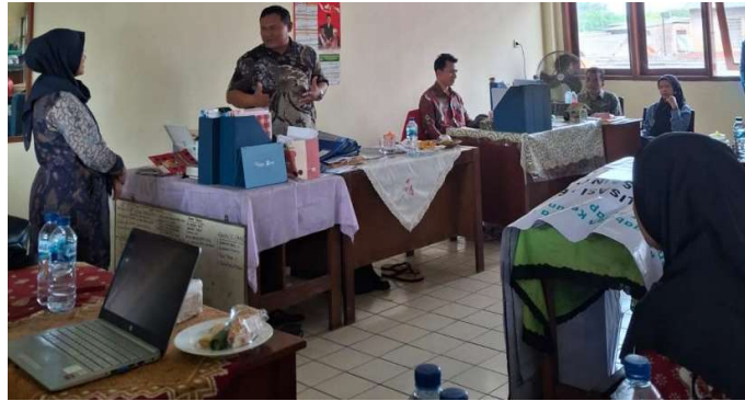
Gambar 2. Tim PKM menyampaikan materi dan diskusi bersama guru