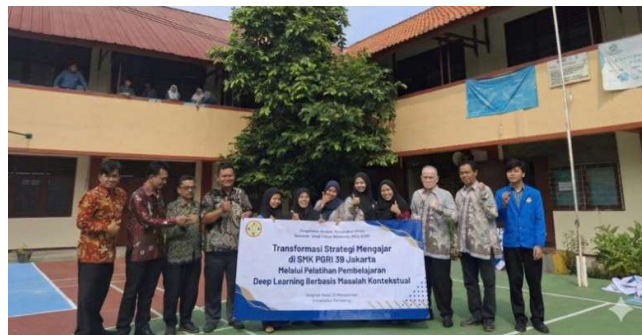
Gambar 1. Foto Tim PKM bersama Guru SMK PGRI 39 Jakarta

Tim pengabdian memberikan sosialisasi kepada guru SMK PGRI 39 Jakarta mengenai pengembangan kompetensi pedagogik melalui penerapan pembelajaran deep learning sebagai strategi untuk mentransformasikan proses mengajar di kelas. Pada tahap ini, tim menyampaikan materi tentang konsep dasar deep learning pedagogis , karakteristik pembelajaran yang menekankan pemahaman mendalam, serta perannya dalam meningkatkan keterlibatan dan kualitas belajar siswa. Sosialisasi juga membahas perbedaan pembelajaran permukaan dan pembelajaran mendalam, serta implikasinya terhadap perencanaan dan pelaksanaan pembelajaran di SMK. Kegiatan ini bertujuan untuk membangun pemahaman awal dan kesadaran guru terhadap pentingnya penerapan strategi pembelajaran deep learning sebagai upaya peningkatan kualitas pembelajaran.