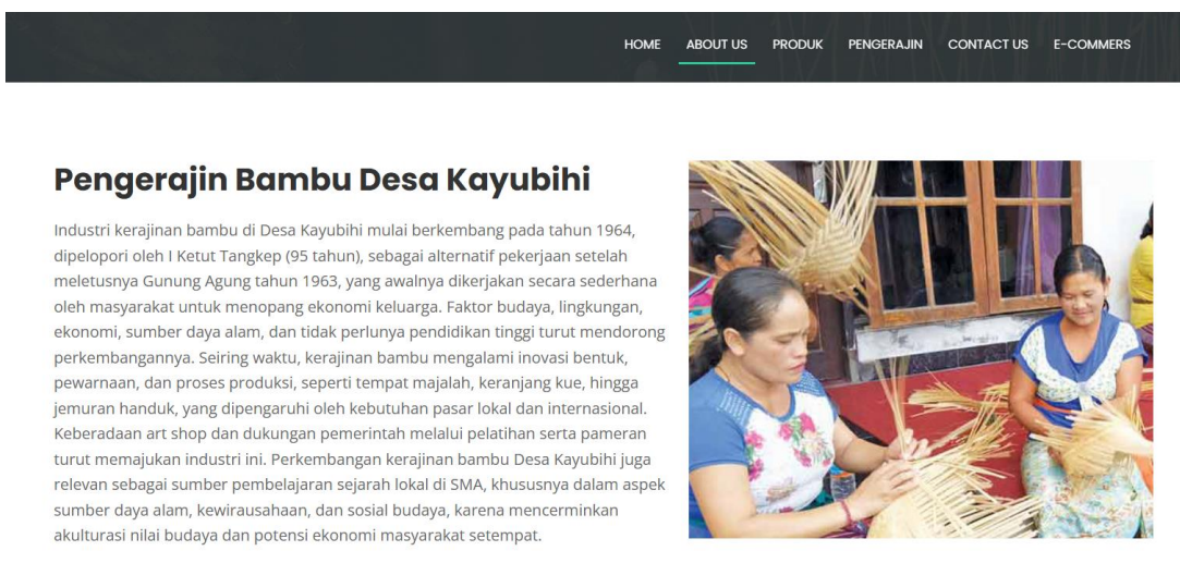
Gambar 3. Website Profile Desa Kayubihi About