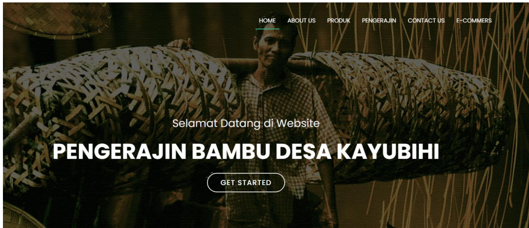
Gambar 2. Website Profile Desa Kayubihi