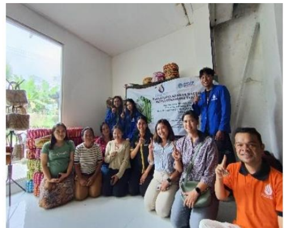
Gambar 5. Dokumentasi Kegiatan

Dari seluruh kegiatan pengabdian yang telah dilakukan maka dalam hasil dan pembahasan ini akan memberikan ukuran ketercapaian permasalahan. Adapun Berikut adalah hasil kegiatan sesuai dengan solusi permasalahan yang diberikan: