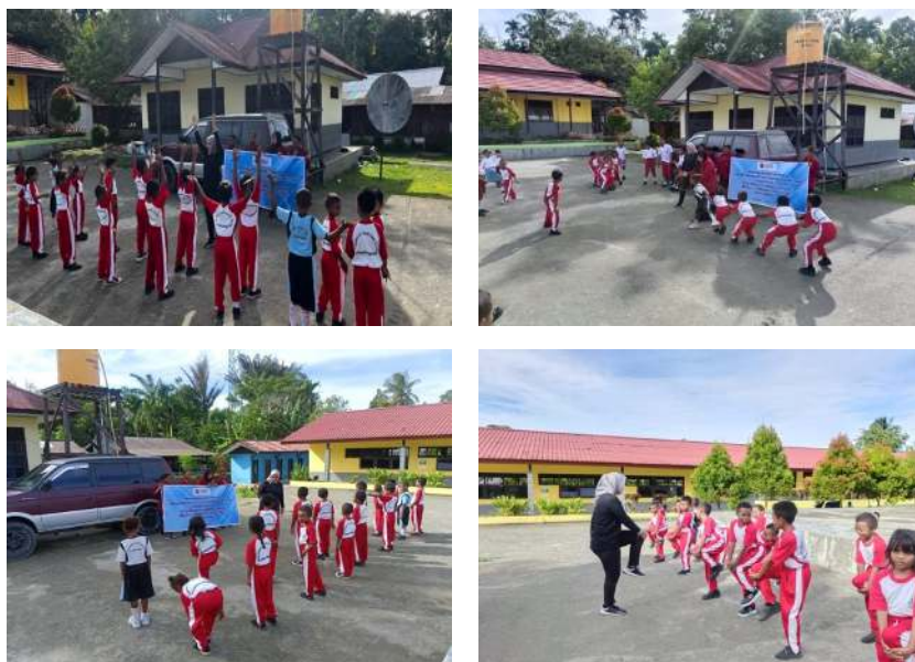
Gambar 2. Aktifitas senam pemanasan, sebelum melakukan permainan tradisional tarik tambang

Pertemuan pertama diawali dengan penulis melakukan observasi terhadap metode pengajaran yang diberikan oleh guru kepada anak-anak. Pada pertemuan kedua, penulis memberikan contoh mengenai peraturan-peraturan dalam permainan tradisional tarik tambang. Pertemuan ketiga menunjukkan perkembangan positif, di mana mayoritas anak-anak sudah memahami aturan, meskipun ada satu atau dua anak yang masih terlalu aktif dan melanggar peraturan permainan. Pada pertemuan keempat, perkembangan terlihat sangat baik. Keberhasilan proses perkembangan motorik kasar anak, melalui model bermain peran dan instruksi eksplisit dalam permainan tradisional tarik tambang, dilakukan dengan cara yang menyenangkan dan bertahap, sesuai dengan kemampuan masing-masing anak (Libranti, 2023). Berdasarkan hasil observasi, terlihat bahwa permainan tradisional tarik tambang efektif dalam memfasilitasi perkembangan motorik kasar anak. Selama bermain, anak-anak belajar teknik tarik tambang yang benar. Permainan ini juga mendorong anak-anak untuk menjadi lebih dinamis, gesit, dan cekatan. Otot-otot mereka akan semakin kuat, padat, dan terlatih dengan baik. Menurut pengabdian yang dilakukan oleh (Hasan Agus & Kholilurrohman, 2025; Puspita & Waroh, 2024), tarik tambang juga dapat membantu mengurangi obesitas pada anak. Selain itu, emosi anak pun lebih terkontrol, sehingga mereka berani mengambil tantangan.