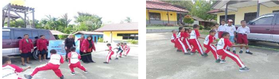
Gambar 1. Aktifitas anak-anak sedang melakukan permainan tradisional tarik tambang

Teknik pengumpulan datanya adalah: 1) data aktivitas guru diperoleh dari observasi aktivitas guru saat menyampaikan pembelajaran motorik kasar dalam pencapaian perkembangan dengan melakukan permainan jasmani secara teratur, 2) data aktivitas anak diperoleh dari observasi selama pembelajaran dan proses pembelajaran yang dikumpulkan dengan menggunakan lembar observasi penilaian dan lembar pengabdian aktivitas anak pada saat kegiatan berlangsung, dan 3) data perkembangan motorik kasar anak dalam melakukan permainan jasmani secara teratur diambil dengan melakukan penilaian setelah kegiatan pembelajaran melalui permainan tradisional tarik tambang di setiap pertemuan.