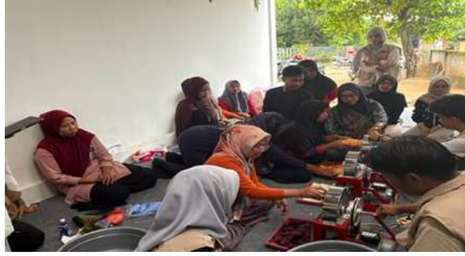
Gambar 1. Kegiatan Pengolahan Ubi jalar menjadi Keripik

Selain KWT, PKK Desa Rejoagung turut berperan dalam pelaksanaan program pemberdayaan ekonomi melalui kegiatan pengolahan dan diversifikasi produk olahan pangan berbasis rumah tangga. Anggota PKK didorong untuk berinovasi dalam menciptakan produk kuliner lokal yang memiliki daya tarik pasar, seperti variasi rasa dan kemasan produk keripik yang disesuaikan dengan preferensi konsumen. Aktivitas ini juga memperkuat kolaborasi sosial dan solidaritas antarperempuan dalam meningkatkan produktivitas ekonomi keluarga serta memperkuat keberlanjutan ekonomi desa.