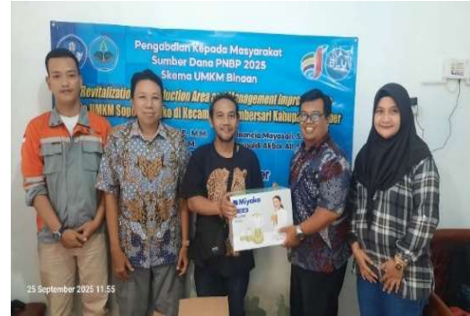
Gambar 3. Serah Terima alat ke Mitra UMKM Sopyongko