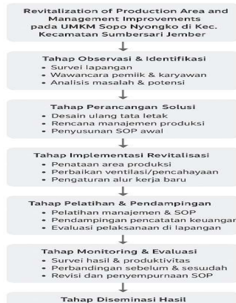
Gambar 1. Diagram alir Pengabdian masyarakat