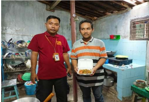
Gambar 2. Produk UMKM Sopyongko

terukur dalam mengembangkan bisnis kecil. Keberhasilan kegiatan ini menjadi bukti bahwa pendampingan berbasis kebutuhan riil dan partisipasi aktif pelaku usaha merupakan kunci utama keberhasilan program pengabdian masyarakat di sektor UMKM. Dengan terciptanya lingkungan kerja yang lebih produktif, tertib, dan efisien, serta penerapan sistem manajemen yang adaptif, UMKM Sopo Nyongko kini memiliki fondasi yang lebih kuat untuk berkembang, memperluas pasar, dan meningkatkan daya saing di tengah dinamika ekonomi lokal maupun nasional.