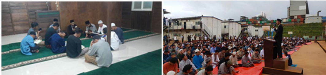
Gambar 6. Dokumentasi Pendampingan dan Menjadi Khatib Idul Fitri

Keenam , kegiatan pendampingan lainnya selama Ramadhan. Selain kegiatan yang telah disebutkan sebelumnya, kegiatan lain yang tidak kalah penting dalam kebersamaan jamaah adalah menyimak hafalan Al-Qur'an, pembenahan tilawah secara bersama, kajian privat sesuai kebutuhan individu, menerima berbagai konsultasi keagamaan, serta menjadi khatib pada Hari Raya Idul Fitri. Materi yang disampaikan dalam kegiatan ini merujuk pada literatur terpercaya, antara lain Mukhtasār al-Fiqh al-Islāmī (Al-Tuwayjiri, 1439) untuk menyelesaikan permasalahan fikih; Profil Keluarga 30 Sahabat Nabi yang Dijamin Masuk Surga (Badr, 2014) untuk memperluas pemahaman terkait masalah keluarga; serta Minhaj ; dan Berislam, dari Ritual hingga Intelektual (Zarkasyi, 2020) untuk menyempurnakan praktik keislaman agar tidak hanya menjadi kebiasaan tetapi juga menumbuhkan keimanan yang hakiki. Semua kegiatan ini dilaksanakan dalam suasana kekeluargaan, sehingga diharapkan proses pembelajaran berlangsung dengan nyaman dan ilmu dapat tersampaikan secara efektif.