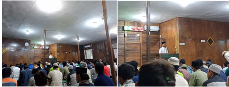
Gambar 5. Dokumentasi Kajian Menjelang Iftar

Keenam , kegiatan pendampingan lainnya selama Ramadhan. Selain kegiatan yang telah disebutkan sebelumnya, kegiatan lain yang tidak kalah penting dalam kebersamaan jamaah adalah menyimak hafalan Al-Qur'an, pembenahan tilawah secara bersama, kajian privat sesuai kebutuhan individu, menerima berbagai konsultasi keagamaan, serta menjadi khatib pada Hari Raya Idul Fitri. Materi yang disampaikan dalam kegiatan ini merujuk pada literatur terpercaya, antara lain Mukhtasār al-Fiqh al-Islāmī (Al-Tuwayjiri, 1439) untuk menyelesaikan permasalahan fikih; Profil Keluarga 30 Sahabat Nabi yang Dijamin Masuk Surga (Badr, 2014) untuk memperluas pemahaman terkait masalah keluarga; serta Minhaj ; dan Berislam, dari Ritual hingga Intelektual (Zarkasyi, 2020) untuk menyempurnakan praktik keislaman agar tidak hanya menjadi kebiasaan tetapi juga menumbuhkan keimanan yang hakiki. Semua kegiatan ini dilaksanakan dalam suasana kekeluargaan, sehingga diharapkan proses pembelajaran berlangsung dengan nyaman dan ilmu dapat tersampaikan secara efektif.