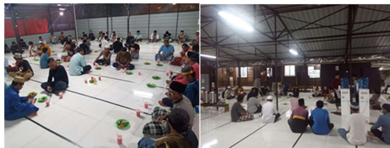
Gambar 4. Dokumentasi Kajian Menjelang Iftar

Keempat , pengisi kajian menjelang iftar. Kegiatan berikutnya adalah menjadi pengisi kajian menjelang iftar, yang dilaksanakan sebanyak 30 pertemuan selama bulan Ramadhan. Dalam setiap sesi, materi yang disampaikan berfokus pada pengembangan karakter dan pembentukan pribadi unggul. Topik yang dibahas mencakup hakikat kesuksesan, potensi diri, usaha mencapai kesuksesan, pemahaman diri manusia, serta adab-adab yang harus dijalani dalam kehidupan sehari-hari. Materi kajian ini banyak merujuk pada buku Muslim Hebat sebagai salah satu sumber referensi (Sahidin, 2022). Kegiatan ini bertujuan untuk memberikan inspirasi dan motivasi praktis bagi para jamaah dalam meningkatkan kualitas diri secara spiritual, moral, dan sosial.