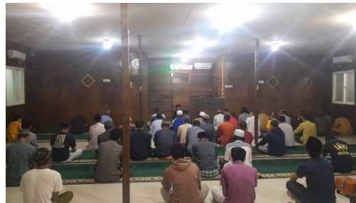
Gambar 3. Dokumentasi Kajian Subuh Selama Ramadhan

Ketiga , pengisi kajian subuh selama Ramadhan. Kegiatan selanjutnya adalah menjadi pengisi kajian subuh yang dilaksanakan sebanyak 30 pertemuan selama bulan Ramadhan. Kajian ini dilakukan setiap bakda shalat Subuh dengan durasi 10–20 menit per sesi. Dalam 30 pertemuan tersebut, peserta berhasil mempelajari tiga risalah yang dihimpun dalam satu buku, yang membahas pokok-pokok masalah aqidah, yakni Uṣūl al-Tsalātsah dan al-Qawā'id al-Arba' , serta pokok-pokok masalah ibadah shalat, yaitu Syurūṭ al-Ṣalāh wa Wājibātuhā wa Arkānuhā (Ibn Abdul Wahab, 1420). Kegiatan ini diharapkan dapat memperkuat pemahaman peserta mengenai prinsip-prinsip dasar aqidah dan tata cara ibadah shalat secara komprehensif.