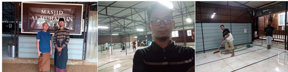
Gambar 1. Dokumentasi Kehadiran dan Kegiatan Bersih-Bersih Masjid

Pertama , kegiatan bersih-bersih menyambut bulan suci. Sebelum bulan Ramadhan tiba, dai yang bertugas diwajibkan hadir di lokasi dakwah. Sesampainya di tempat tujuan, pengurus masjid menginisiasi kegiatan pembersihan masjid secara menyeluruh dengan melibatkan dai yang telah hadir. Kegiatan ini tidak hanya bertujuan menyiapkan sarana ibadah yang bersih dan nyaman, tetapi juga mendorong terbentuknya interaksi sosial yang erat antara dai, pengurus masjid, dan relawan jamaah yang menyempatkan waktu untuk berpartisipasi dalam pembersihan masjid. Aktivitas ini sekaligus memperkuat ukhuwah dan semangat kebersamaan dalam komunitas masjid.