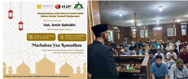
Gambar 2. Dokumentasi Menjadi Khatib Tarwaih Selama Ramadhan

Ketiga , pengisi kajian subuh selama Ramadhan. Kegiatan selanjutnya adalah menjadi pengisi kajian subuh yang dilaksanakan sebanyak 30 pertemuan selama bulan Ramadhan. Kajian ini dilakukan setiap bakda shalat Subuh dengan durasi 10–20 menit per sesi. Dalam 30 pertemuan tersebut, peserta berhasil mempelajari tiga risalah yang dihimpun dalam satu buku, yang membahas pokok-pokok masalah aqidah, yakni Uṣūl al-Tsalātsah dan al-Qawā'id al-Arba' , serta pokok-pokok masalah ibadah shalat, yaitu Syurūṭ al-Ṣalāh wa Wājibātuhā wa Arkānuhā (Ibn Abdul Wahab, 1420). Kegiatan ini diharapkan dapat memperkuat pemahaman peserta mengenai prinsip-prinsip dasar aqidah dan tata cara ibadah shalat secara komprehensif.