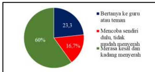
Gambar 1. Respon yang ditunjukkan Saat Menghadapi Kesulitan dalam Belajar

Untuk mengembangkan siswa menjadi manusia yang sesuai dengan Sistem Pendidikan Nasional, diperlukan grit yang tinggi. Menurut (Muhibbin & Wulandari, 2021) grit akademik memiliki pengaruh lebih besar terhadap keberhasilan akademik siswa dibandingkan kecerdasan semata, di mana konsistensi minat dan ketekunan dalam studi berperan penting dalam pencapaian akademik. Grit akademik memiliki peran penting dalam keberhasilan pendidikan sekolah. Duckworth (2018) mengatakan bahwa individu yang termotivasi dan rajin memiliki kemungkinan lebih besar untuk mencapai kesuksesan dibandingkan dengan individu yang memiliki potensi alami tetapi tidak mengejanya dengan ketekunan. Survei awal ini dilaksanakan dengan melibatkan sebanyak 30 siswa SMA Negeri 1 Muara Badak. Pertanyaan-pertanyaan pada survei awal mencakup 2 (dua) hal yakni respon yang ditunjukkan saat menghadapi kesulitan dalam belajar dan respon emosional saat menghadapi pelajaran yang sulit. Hasil survei awal sebagai berikut: