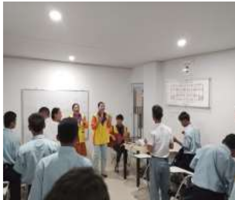
Gambar 1. Ibadah

Suasana pembelajaran yang menyenangkan terbukti efektif dalam meningkatkan keterlibatan peserta. Ice breaking dan aktivitas kelompok yang dirancang dengan kreatif menciptakan lingkungan belajar yang rendah tekanan namun tinggi partisipasi. Temuan ini mendukung penelitian Iwani, yang menekankan pentingnya pembelajaran menyenangkan dalam meningkatkan motivasi belajar. Secara hukum, Sumiati mengutip UU No.20 Pasal 40 ayat 2 yang mewajibkan guru menciptakan suasana pendidikan yang bermakna, menyenangkan, kreatif, dinamis, dan dialogis. Hura juga menyoroti pentingnya pendekatan berbasis proyek yang membuat siswa merasa bangga karena menciptakan hasil sendiri yang memiliki nilai dan makna. Dalam perspektif kristiani, kegembiraan ini tidak sekadar emosi sesaat, tetapi merupakan ekspresi sukacita dalam Tuhan (Filipi 4:4) yang menjadi sumber motivasi intrinsik, sebagaimana dijelaskan Brill dalam Sukacita, Tentang, D A N Penerapannya, and D I Jemaat, 2023 bahwa sebagai jemaat Tuhan, orang-orang percaya harus selalu bersukacita dalam Tuhan, dengan sukacita yang berasal dari anugerah Tuhan.