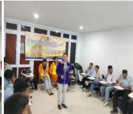
Gambar 2. Penerapan materi