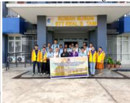
Gambar 6. Foto Bersama

Kegiatan diikuti secara aktif oleh 15 siswa yang didampingi oleh guru pembina. Selama pelaksanaan workshop, peserta menunjukkan antusiasme tinggi dengan keterlibatan optimal dalam setiap sesi, baik ceramah interaktif, diskusi kelompok, maupun tanya jawab. Tingkat kehadiran mencapai 100% tanpa ada peserta yang meninggalkan kegiatan sebelum selesai. Untuk mengukur efektivitas program, dilakukan tes evaluasi melalui angket yang mencakup aspek kognitif dan afektif. Hasil analisis menunjukkan distribusi pemahaman peserta sebagai berikut: 50% menjawab dengan sangat baik, 30% dengan baik, 16% dengan cukup baik, dan 4% dengan kurang baik. Data ini mengindikasikan bahwa 80% peserta telah mencapai pemahaman yang memadai hingga sangat baik terhadap materi pembelajaran mendalam dan bimbingan konseling PAK. Hanya sebagian kecil (4%) yang memerlukan pendampingan lebih lanjut.