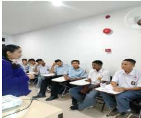
Gambar 3. Tanya jawab