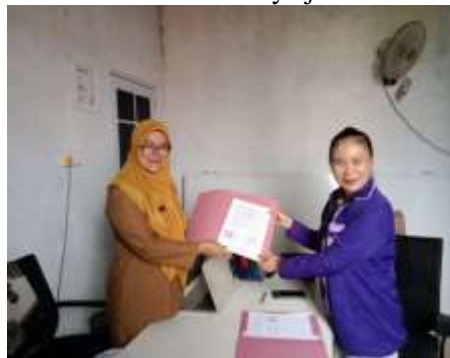
Gambar 5. Peyerahan MoU