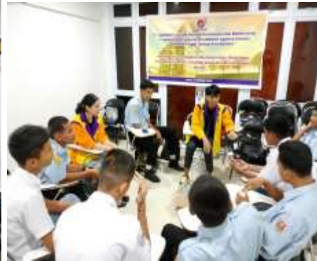
Gambar 4. Konseling