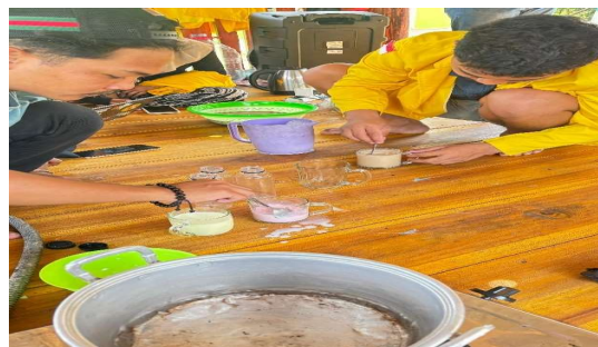
Gambar 5. Pemberian varian rasa pada susu kambing

Keberhasilan pelaksanaan PkM ini dapat dilihat pada kemampuan peternak dalam mengadopsi teknik sanitasi yang ditunjukkan melalui peningkatan signifikan pada praktik sterilisasi kambing sebelum pemerahan, yang menurunkan tingkat kontaminasi fisik pada susu. Selain itu penggunaan konsentrat tambahan dan hijauan terfermentasi mulai diterapkan secara konsisten oleh peternak, yang berdampak pada stabilitas produksi susu. Secara rata-rata, terjadi kenaikan volume produksi susu sebesar 15-20% per ekor dibandingkan periode sebelum pendampingan. Hasil pengujian sederhana menunjukkan susu memiliki ketahanan simpan yang lebih lama dan aroma yang lebih segar akibat manajemen pasca-panen yang lebih baik. Selain dijual ke swalayan ada juga peternak yang mengikuti saran dari pelaksana pengabdian untuk memberikan varian rasa pada produksi susu kambingnya, yang dapat digunakan sebagai daya tarik baru bagi siswa-siswi pada sekolah tingkat dasar dan pertama serta menengah.