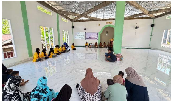
Gambar 1. Pelaksanaan diskusi dengan peternak

Pada tahapan awal, dilakukan dengan pemetaan permasalahan dan kebutuhan masyarakat yang dilakukan dengan melaksanakan survei serta wawancara kepada peternak kambing untuk mengetahui permasalahan dan kebutuhan yang berkaitan dengan produksi serta mutu susu kambing. Pelaksanaan tersebut dilakukan dengan cara menghimpun informasi mengenai kondisi peternakan, sistem pengelolaan, dan tingkat produksi serta kualitas susu kambing, serta beberapa aspek yang penting seperti (1) kondisi fisik peternakan (luas peternakan, jenis dan kondisi peternakan, termasuk keadaan kandang dan pakan serta ketersediaan air dan listrik). (2) sistem pemeliharaan kambing (intensif, semi-intensif, ekstensif).