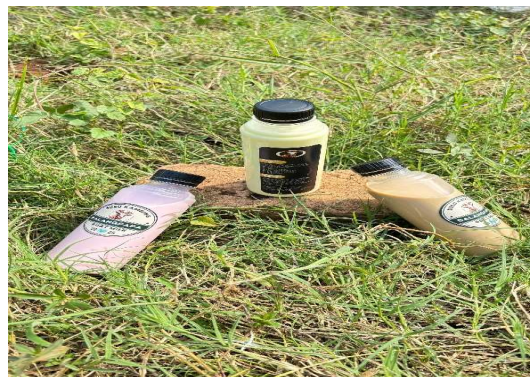
Gambar 6: Pengemasan susu kambing yang telah diberikan varian rasa

Pelaksanaan PkM ini dipandang memiliki keberhasilan, namun terdapat kendala yang dialami peternak, seperti kontinuitas bahan baku pakan, fluktuasi harga bahan tambahan pakan terkadang membuat peternak kembali ke pola lama (pakan seadanya). Selain itu terdapat keterbatasan peternak pada alat pengolahan susu kambing, bahwa terbatasnya peralatan cold chain (rantai dingin) yang memadai di Dusun Balangpapa menghambat distribusi susu ke pasar yang lebih luas. Pada sisi personal peternak ditemukan jika pencatatan produksi masih sering terlupakan, sehingga data produksi belum sepenuhnya akurat 100%.