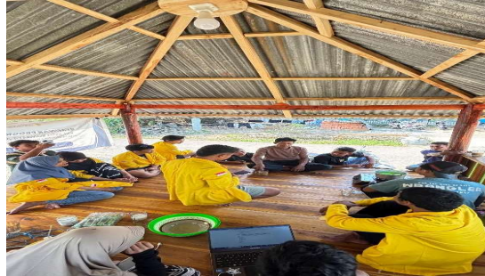
Gambar 4. Pelaksanaan Pasteurisasi susu kambing

Keberhasilan pelaksanaan PkM ini dapat dilihat pada kemampuan peternak dalam mengadopsi teknik sanitasi yang ditunjukkan melalui peningkatan signifikan pada praktik sterilisasi kambing sebelum pemerahan, yang menurunkan tingkat kontaminasi fisik pada susu. Selain itu penggunaan konsentrat tambahan dan hijauan terfermentasi mulai diterapkan secara konsisten oleh peternak, yang berdampak pada stabilitas produksi susu. Secara rata-rata, terjadi kenaikan volume produksi susu sebesar 15-20% per ekor dibandingkan periode sebelum pendampingan. Hasil pengujian sederhana menunjukkan susu memiliki ketahanan simpan yang lebih lama dan aroma yang lebih segar akibat manajemen pasca-panen yang lebih baik. Selain dijual ke swalayan ada juga peternak yang mengikuti saran dari pelaksana pengabdian untuk memberikan varian rasa pada produksi susu kambingnya, yang dapat digunakan sebagai daya tarik baru bagi siswa-siswi pada sekolah tingkat dasar dan pertama serta menengah.