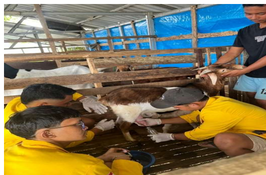
Gambar 3. Proses pemerasan susu kambing

Pelaksanaan pemantauan dilakukan secara berkala (harian dan mingguan) dilakukan melalui peninjauan langsung kondisi fisik kandang, kesehatan ternak, dan kebersihan alat peras yang kemudian dilanjutkan dengan diskusi dengan anggota kelompok peternak mengenai kendala teknis dan perubahan pola pikir dalam pengelolaan ternak. Hasil produksi diarahkan untuk dicatat dalam buku catatan harian produksi susu untuk melihat tren volume harian sebelum dan sesudah dilakukannya pelatihan dan pendampingan (Sitepu et al., 2025).