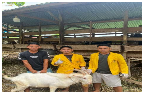
Gambar 2. Persiapan Pemerahan Susu Kambing

Berikutnya untuk tahapan implementasi teknologi dan manajemen peternakan, bahwa peternak kambing akan didampingi dalam menerapkan teknologi dan sistem manajemen peternakan yang sesuai untuk meningkatkan produksi dan kualitas susu kambing. Pendampingan akan dilakukan instansi terkait didampingi kelompok pengabdian, bahwa dalam menerapkan teknologi pakan yang sesuai, seperti penggunaan pakan fermentasi dan konsentrat. Peternak kambing didampingi dalam menerapkan sistem manajemen kesehatan yang sesuai, seperti program vaksinasi dan pengobatan penyakit. Untuk penerapan sistem manajemen reproduksi, peternak kambing di dampingi dalam menerapkan sistem manajemen reproduksi yang sesuai, seperti program inseminasi buatan dan pengawasan kebuntingan. Selanjutnya untuk sistem manajemen lingkungan, para peternak kambing akan didampingi dalam menerapkan sistem manajemen lingkungan yang sesuai, seperti pengelolaan limbah dan pengawasan kebersihan kandang yang berorientasi agar peternakan kambing menjadi lebih bersih dan sehat sehingga tahapan ini diharapkan dapat membantu peternak kambing dalam meningkatkan produksi dan kualitas susu kambing, serta meningkatkan efisiensi dan efektivitas pengelolaan peternakan kambing, dan meningkatkan kesejahteraan hewan dan lingkungan sekitar kandang kambing.