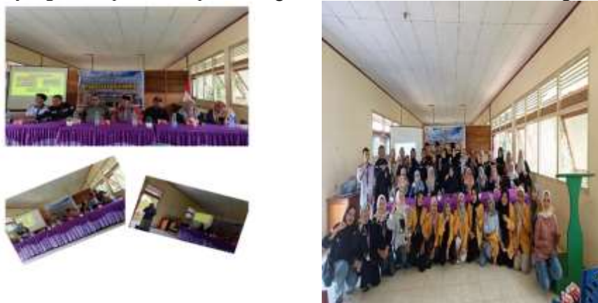
Gambar 1. Dokumentasi Kegiatan

Hasil yang di dapat dalam kegiatan pengabdian yang dilakukan adalah pengetahuan akan pencatatan keuangan sederhana, yang diharapkan ibu-ibu kader mampu menrepkan hal tersebut dalam kehidupan sehari-hari terutama untuk perencanaan keuangan dengan menyusun anggaran rumah tangga berbasis prioritas kebutuhan yang ada. Sehingga mampu merubah pola pikir masyarakat dan perubahan perilaku keuangan yang diharapkan mampu meningkatkan ketahanan ekonomi keluarga.