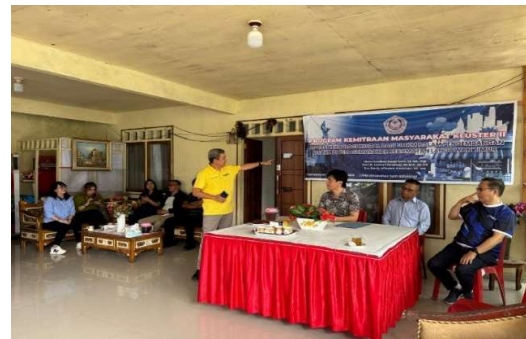
Gambar 3. Kegiatan Pendampingan pemanfaatan teknologi digital bagi UMKM

Teknologi digital yang diperkenalkan adalah pemanfaatan telepon pintar dan beberapa aplikasi yang menjadi rekomendasi tim pengabdian dalam pengembangan usaha mereka. Beberapa aplikasi di antaranya adalah: