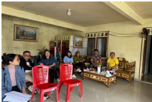
Gambar 2. Kegiatan Penyuluhan pemanfaatan teknologi digital bagi UMKM

Kegiatan pengabdian ini berhasil dilaksanakan sesuai rencana melalui tiga tahap pelatihan utama. Kegiatan PKM ini sangat bermanfaat bagi masyarakat yang ada di Desa Sumarayar, Langowan Timur karena melalui kegiatan ini masyarakat dapat mempelajari hal-hal yang baru dalam mengembangkan UMKM mereka khususnya dengan pemanfaatan teknologi digital bagi usaha mereka dan pemanfaatan pembiayaan dari perbankan.