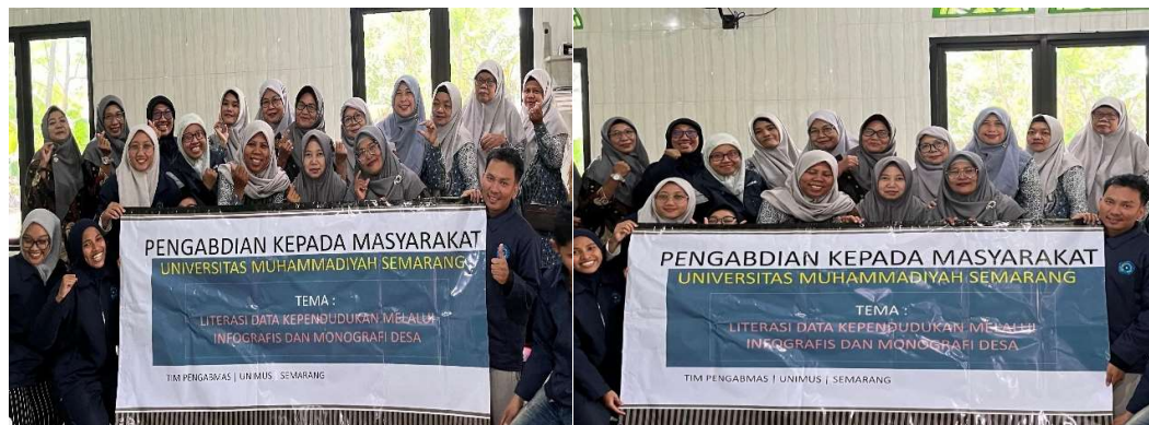
Gambar 5. Kegiatan Tim Pengabmas dengan Seluruh Peserta yaitu Kader Posyandu

Berdasarkan Gambar 4, grafik menunjukkan peningkatan rata-rata skor pre-test dari 69,55 menjadi 89,78 dari rata-rata skor post test. Rata-rata semua peserta skor pre-test lebih tinggi dari pada skor post-test, hal ini menunjukkan meningkatnya pemahaman peserta terhadap pentingnya literasi data melalui infografis dan monografi yang merupakan indikator keberhasilan kegiatan pengabdian masyarakat tersebut.