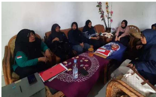
Gambar 1. Wawancara Tim Pengabmas dengan Staf Kader Posyandu

Kunjungan ke kader Posyandu RW 1 Kelurahan Pedurungan Lor merupakan langkah awal dalam studi pendahuluan untuk mendapatkan informasi di lapangan. Dalam kunjungan ini, tim pengabdian masyarakat melakukan serangkaian wawancara mendalam dengan para kader Posyandu. Tujuan utama dari wawancara ini adalah untuk mengumpulkan informasi langsung dari mereka yang berinteraksi dengan sistem administrasi kependudukan setiap hari. Berdasarkan wawancara tersebut, tim berhasil mendapatkan informasi observasi dan penelusuran menunjukkan beberapa permasalahan utama, yaitu: pencatatan data Posyandu yang belum dilakukan secara optimal oleh kader, minimnya pemutakhiran data, kurangnya kompetensi kader dalam mengelola dan menyajikan data secara informatif, terutama dalam bentuk visual seperti infografis, kader bekerja berdasarkan kebiasaan, bukan data, sehingga intervensi kesehatan tidak tepat sasaran.