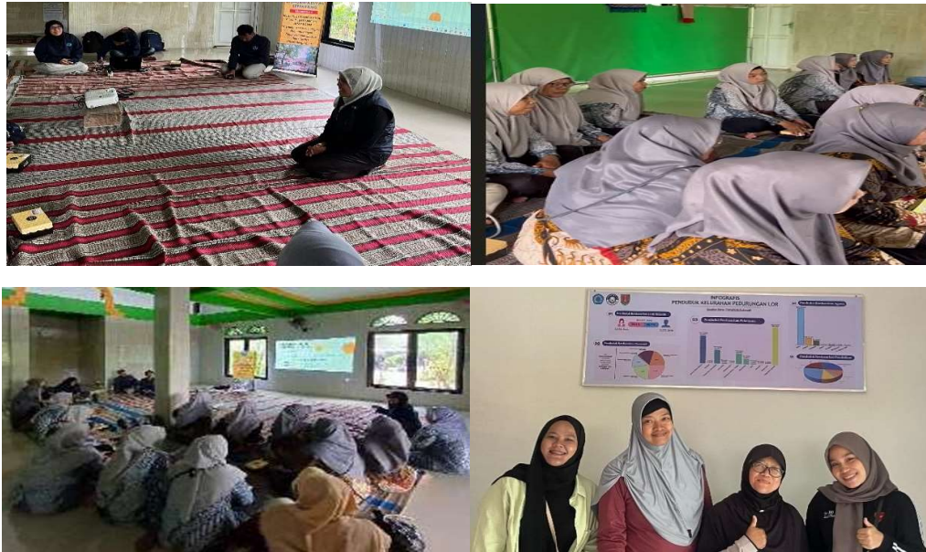
Gambar 2. Interaksi Tim Pengabdian dengan peserta Kader Posyandu

Gambar 2 yang disertakan menggambarkan interaksi langsung antara tim pengabdian masyarakat dengan peserta yaitu para Kader Posyandu. Ini merupakan bukti nyata dari komitmen untuk bekerja sama dengan semua pihak yang terlibat dan memastikan bahwa kegiatan pelatihan berbasis teknologi relevan dan mudah digunakan oleh kader Posyandu.