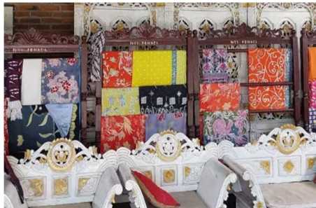
Gambar 1. Beberapa Jenis Kain Batik Khas Tangerang Dengan Motif Parakan

Berdasarkan hasil wawancara dengan Bapak H. Ali Taba, tokoh budaya sekaligus penggagas Batik Tangerang, mengungkap bahwa proses lahirnya batik khas Tangerang telah dimulai sejak tahun 2007 melalui rancangan desain awal. Rancangan tersebut kemudian diwujudkan ke dalam bentuk kain pada tahun 2010. Puncak perkembangannya terjadi pada tahun 2013, ketika lahir brand Nyipohaci dengan motif khas Rambutan Parakan yang saat ini sudah terdaftar hak patennya. Motif tersebut bukan hanya menonjolkan nilai estetika, melainkan juga mengandung makna filosofis, yakni mengingatkan manusia untuk tetap menjaga jati diri meskipun memiliki berbagai kelebihan.