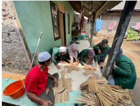
Gambar 3. Proses Pembuatan Anyaman Tampah di Kampung Budaya Desa Kemuning

Temuan di lapangan sejalan dengan teori pemberdayaan masyarakat yang menekankan bahwa keterlibatan warga secara aktif dalam kegiatan kreatif mampu meningkatkan kapasitas individu sekaligus memperkuat modal sosial (Zimmerman, 2018). Kehadiran Batik Tangerang dengan motif Rambutan Parakan juga dapat dipandang sebagai bentuk cultural branding yang berfungsi ganda: menjaga identitas budaya lokal sekaligus menciptakan nilai ekonomi (Suryani, 2021).