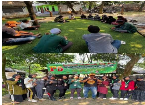
Gambar 5. Proses Pembuatan Anyaman Tampah di Kampung Budaya Desa Kemuning

Keterlibatan perempuan dalam proses produksi batik mendukung temuan (Rahmawati, N., & Hidayat, 2022) yang menunjukkan bahwa batik berperan sebagai instrumen pemberdayaan perempuan. Sementara itu, pengembangan produk lain seperti anyaman dan opak mencerminkan penerapan konsep community-based creative economy, yang mengedepankan pemanfaatan sumber daya lokal secara partisipatif dan berkelanjutan (Prasetyo, 2021).