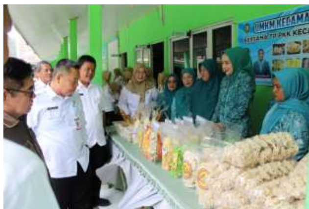
(e)Kemasan di pameran di kecamatan