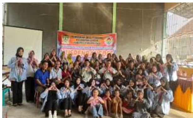
(b)Pemateri dengan Perangkat Desa