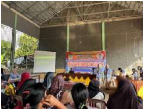
(a)Pemaparan materi SERASI

Berikut adalah dokumentasi kegiatan pelatihan UMKM.