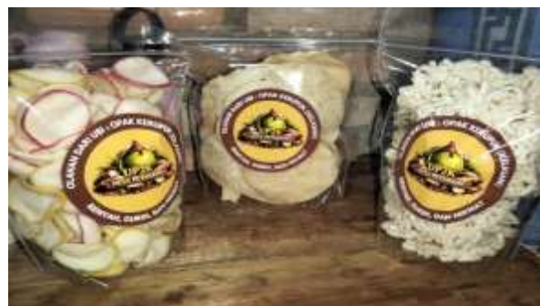
(d)Pemasangan Logo \