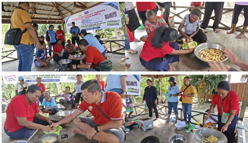
Gambar 1. Kegiatan PkM Pembuatan Keripik Pisang Aneka Rasa

Kegiatan pengabdian kepada masyarakat di Kampung Yongsu Desoyo telah dilaksanakan dengan melibatkan Mama-mama Papua sebagai aktor utama dalam rantai nilai pangan lokal. Hasil dari kegiatan ini menunjukkan perubahan signifikan pada aspek pengetahuan, keterampilan teknis, dan kesadaran akan nilai ekonomi produk olahan. Berdasarkan hasil evaluasi melalui pre-test dan post-test , terjadi peningkatan pemahaman peserta terhadap pengolahan pisang. Sebelum pelatihan, sebagian besar peserta (75%) hanya mengetahui pengolahan pisang sebatas direbus atau digoreng biasa untuk konsumsi rumah tangga. Setelah pelatihan, peserta memahami teknik penggorengan yang tepat agar keripik tetap renyah ( crispy ) dan cara pencampuran menggunakan bumbu tabur instan serbaguna Antaka varian rasa (keju, jagung manis, dan balado) secara merata.