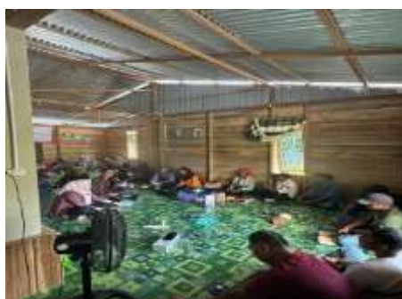
Gambar 3. Kegiatan Pengabdian Kepada Masyarakat

Kegiatan diawali dengan pembukaan program pengabdian kepada masyarakat oleh Tim Pengabdian. Selanjutnya, para peserta mengisi daftar hadir yang telah disediakan oleh panitia dan mengikuti pelatihan pengelolaan keuangan. Beberapa tahapan yang diberikan, yaitu sebagai berikut: