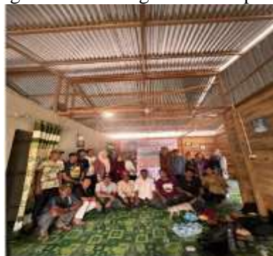
Gambar 6. Pendampingan dan Praktik kepada Pokdarwis

Untuk mengembangkan dan mengimplementasikan sistem pencatatan keuangan yang sesuai dengan kebutuhan dan kondisi serta keterampilan yang dimiliki oleh bendahara pokdarwis. Setelah pelatihan, tim mendampingi mitra dalam melakukan praktik langsung penggunaan aplikasi Excel selama beberapa waktu. Pada tahap ini, mitra akan didorong untuk memasukkan transaksi harian secara langsung ke aplikasi, dengan dukungan dan bimbingan dari tim pendamping.