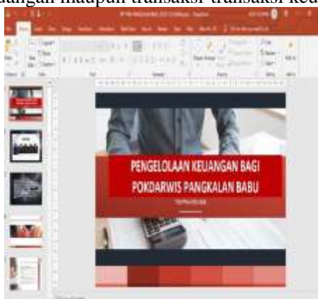
Gambar 4. Sosialisasi Pengelolaan Keuangan

Sosialisasi dilakukan untuk meningkatkan pemahaman mitra tentang konsep dan manfaat pengelolaan keuangan. Materi berkaitan tentang pentingnya pengelolaan keuangan serta metode- metode dalam pencatatan pelaporan keuangan maupun transaksi-transaksi keuangan.