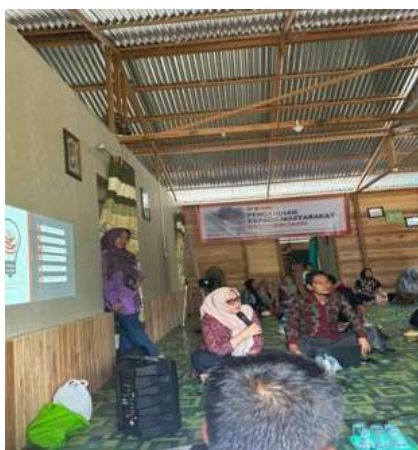
Gambar 5. Pelatihan dan Simulasi kepada Pokdarwis

Pelatihan pemahaman pencatatan transaksi- transaksi keuangan secara sederhana dengan kertas kerja baik itu dengan jurnal umum sederhana dan mengelompokkannya kembali ke dalam laporan keuangan sederhana seperti neraca, laporan laba rugi dan laporan arus kas. Materi juga dilengkapi dengan aplikasi Excel yang sudah diprogram untuk penginputan laporan keuangan yang bisa digunakan secara langsung sehingga bisa diklasifikasi dengan mudah oleh bendahara selaku pengelola keuangan daerah wisata Pangkal Babu.