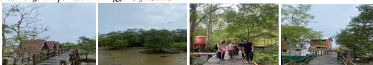
Gambar 1. Kondisi Ekowisata Pangkal

menyuksekkan pembangunan kepariwisataan, (10) Luas kawasan Hutan mangrove Pangkal Babu yaitu sekitar 20ha. Hutan mangrove Pangkal Babu ini memiliki kekayaan flora dan fauna yang bermacam. Pangkal Babu merupakan julukan kawasan yang terletak di Desa Tungkal 1, Tungkal Ilir, Kabupaten Tanjung Jabung Barat. Lokasi yang tersembunyi namun memiliki potensi wisata khususnya ekowisata yang memukau. Adapun potensi wisatanya terdiri dari hutan bakau, hewan yang hidup di area tersebut seperti tembakul, monyet, siput, kepiting dan lain sebagainya, selain itu juga menyimpan keindahan tersendiri yaitu hamparan pasir putih yang menghadap laut lepas China serta wisata mangrovenya. Sejak dibukanya kawasan ekowisata pada akhir tahun 2019, atensi pengunjung yang cukup tinggi, yaitu pada awal tahun 2020 mencapai 18.600 pengunjung, peningkatan terus terjadi selama 4 bulan berturut-turut namun terjadinya dengan masa pandemi covid-19 sehingga Pangkal Babu menjadi sepi pengunjung dan terbengkalai, (11). Namun sejak dibuka kembali untuk umum setelah pandemi, berdasarkan hasil wawancara dengan pengelola pokdarwis setempat jumlah kunjungan wisata terus meningkat, rata-rata bisa sampai 200-300 kunjungan dalam sehari dengan tiket masuk seharga Rp 5.000 sehingga pokdarwis bisa mengelola pemasukan hingga 45 juta/bulan.