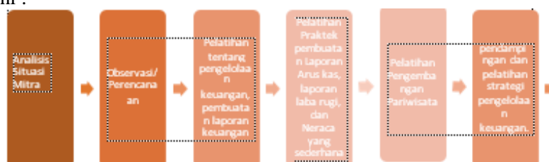
Gambar 2. Alur Kegiatan Pengabdian

Kegiatan pengabdian pada masyarakat ini dilakukan dengan melakukan pelatihan dan pendampingan untuk mengoptimalkan kapasitas pengelolaan keuangan di kawasan pariwisata mangrove Pangkal Babu untuk meningkatkan pemahaman dan pengetahuan dalam menyusun laporan keuangan yang dikelola oleh Pokdarwis Pangkal Babu. Adapun alur kegiatan pengabdian ini dapat dilihat pada gambar berikut ini :