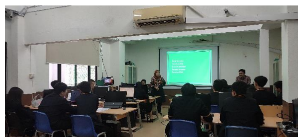
Gambar 1. (a) Pengenalan tim pengabdian dan (b) pembahasan materi komunikasi