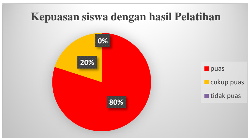
Gambar 4. Kepuasan siswa dengan hasil Pelatihan

Pada gambar 4 di bawah ini terlihat kepuasan siswa dengan hasil pelatihan, memiliki tingkat kepuasan sebanyak 80% atau 12 siswa yang menjawab puas diadakannya pelatihan dan kategori selanjutnya sebanyak 20% atau 3 siswa yang menjawab cukup puas. Total keseluruhan siswa adalah 15 responden. Sedangkan kategori tidak puas berjumlah 0%. Dalam hasil survey ini dapat disimpulkan bahwa siswa kelompok belajar di PT Lintas Digital Makmur mendukung penuh diadakannya pelatihan seperti ini.