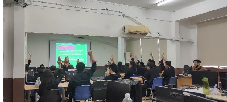
Gambar 2 (a) siswa bertanya

Foto siswa yang aktif tanya jawab dengan tim pengabdian, serta foto pemberian hadiah untuk siswa yang aktif dan siswa yang menjawab pertanyaan dengan benar.