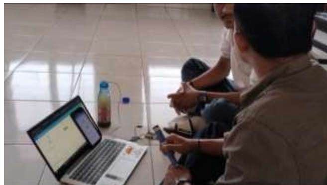
Gambar 2. Tahapan Implementasi