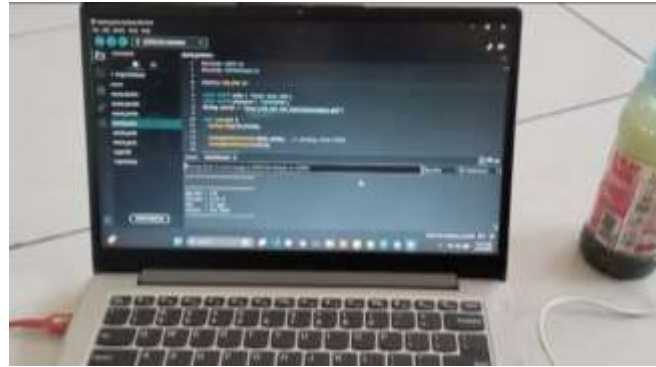
Gambar 1. Perancangan program pada NodeMCU ESP 8266