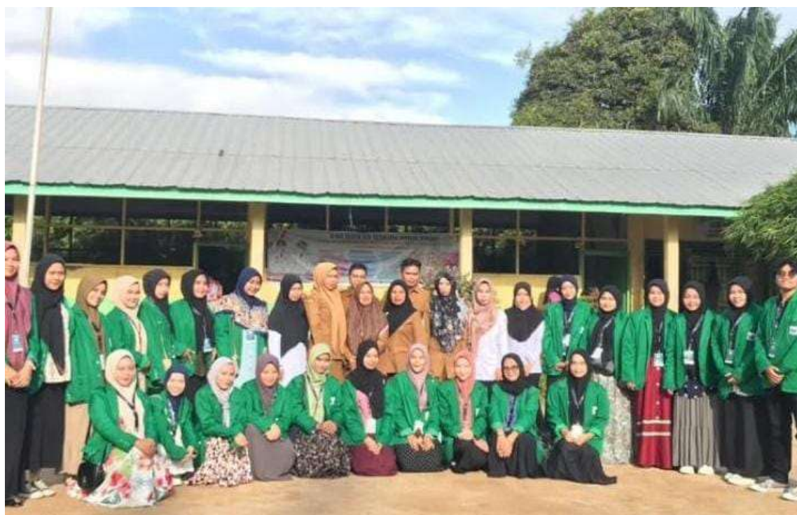
Gambar 1. Mahasiswa yang Melaksanakan Pengabdian Masyarakat

yang memilih mengamati terlebih dahulu sebelum terlibat aktif. Variasi respons ini menjadi titik awal yang penting untuk melihat bagaimana program memengaruhi dinamika interaksi sosial anak secara perlahan.