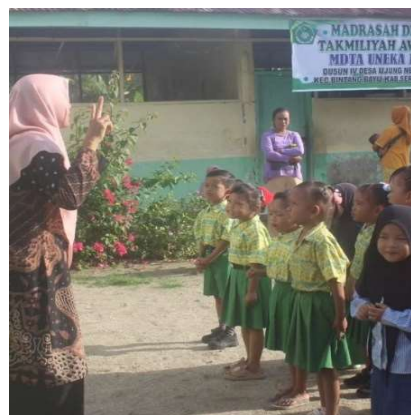
Gambar 2. Pelaksanaan Program Sosialisasi

Selama program berlangsung setiap aktivitas dirancang untuk memancing partisipasi. Anak tidak hanya menjadi peserta pasif yang menerima instruksi, tetapi didorong untuk berperan sebagai pelaku utama dalam interaksi sosial. Melalui pengamatan harian, terlihat bahwa anak yang pada awalnya cenderung diam mulai berani terlibat dalam percakapan kelompok. Mereka mulai menyapa teman secara spontan, bertanya, serta memberi tanggapan sederhana. Proses ini memperlihatkan bahwa pembelajaran sosial terjadi melalui pengalaman langsung, bukan sekadar melalui arahan verbal. Anak belajar memahami situasi sosial dengan cara mengalaminya sendiri.