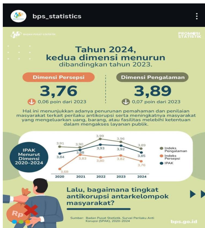
Gambar 2. Perbandingan Kedua Dimensi

Pendidikan yang seharusnya menjadi tempat untuk diajarkan nilai-nilai antikorupsi belum sepenuhnya terwujud. Masih sering ditemukan oknum tenaga pendidik yang belum memberikan keteladanan antikorupsi, dimulai dari hal-hal sederhana seperti absen mengajar tanpa alasan, praktik gratifikasi, pungutan liar, dan penyelewengan dana. Sementara itu di sisi lain, KPK menanggapi kenaikan IPK 2024 ini sebagai kabar baik sekaligus tantangan untuk ke depannya. KPK juga telah menerbitkan Panduan Cegah Korupsi (Pancek) melalui Direktorat Antikorupsi Badan Usaha (AKBU) dan platform jaga.id yang juga memungkinkan masyarakat untuk melaporkan praktik korupsi dalam skala kecil. Tidak lupa, di sektor pendidikan pun terus dilakukan upaya penguatan pendidikan antikorupsi di seluruh jenjang pendidikan. Pendalaman nilai antikorupsi di dunia pendidikan ini diharapkan dapat membangun generasi yang memiliki integritas tinggi dan menjauhi praktik korupsi sejak dini.