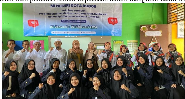
Gambar 2. Dokumentasi Kegiatan

Keterlibatan guru MIN Kota Bogor sangat penting dalam menyukkseskan kegiatan workshop penulisan karya tulis ilmiah tersebut. Guru terlibat dalam kegiatan tanya jawab dan memberikan pengalamannya Ketika diberikan kesempatan oleh pemateri dalam menjawab pertanyaan, guru terlibat aktif dalam penulisan karya tulis ilmiah dalam bentuk jurnal. Guru terlibat aktif mengisi kuesioner atau angket yang disediakan oleh pemateri terkait kepuasan dalam mengikuti acara workshop tersebut.