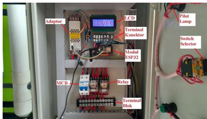
Gambar 7. Komponen Kotak Panel SIMFATISI