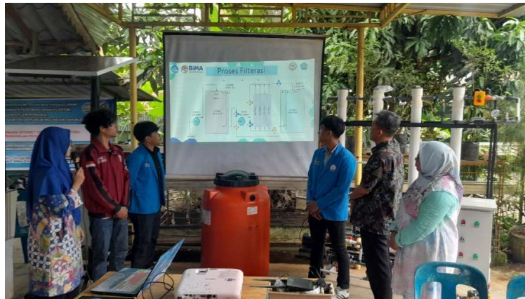
Gambar 4. Sosialisasi Implementasi SIMFATISI

Pada kegiatan pengabdian ini, tim pengusul menggunakan metode sosialisasi untuk mengatasi masalah kurangnya pemahaman mitra terhadap parameter-parameter kualitas air yang sesuai untuk budidaya ikan air tawar (masalah produksi). Parameter kualitas air yang diperhatikan untuk budidaya ikan air tawar meliputi suhu, PH, level air, kekeruhan, oksigen terlarut, dan TDS (Ali et al., 2020). Selain itu, juga disosialisasikan bagaimana cara mempertahankan kualitas air agar sesuai untuk pertumbuhan ikan air tawar. Kegiatan sosialisasi terkait implementasi Sistem Filter Air Otomatis Berbasis Internet of Things (SIMFATISI) telah dilakukan kepada mitra seperti diperlihatkan pada Gambar 4 berikut.