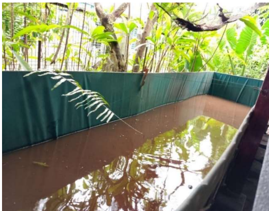
Gambar 2. Budidaya Ikan Air Tawar pada Kolam Terpal

Kondisi eksisting kelompok tersebut belum menerapkan teknologi untuk meningkatkan kualitas dan kuantitas hasil panen ikan air tawar. Berdasarkan survei di lapangan yang dilakukan oleh tim pengabdian, Kelompok Tani Pondok Miri Asri memiliki beberapa masalah di bidang produksi budidaya ikan dan manajemen. Masalah di bidang produksi meliputi pertumbuhan ikan yang lama dan kematian ikan akibat penyakit (Yuliani et al., 2023). Saat ini, waktu panen ikan yang diperlukan adalah enam bulan dengan berat ikan nila rata-rata 250 gram/ekor. Masalah di bidang manajemen yaitu kelompok tani tersebut hanya menjual hasil panen di pasar setempat. Dengan demikian, petani belum dapat melakukan budidaya ikan air tawar secara optimal. Mitra sasaran pada kegiatan ini adalah kelompok masyarakat produktif secara ekonomi, yaitu Kelompok Tani Pondok Miri Asri. Salah satu sektor usaha yang dimiliki oleh kelompok tersebut adalah budidaya ikan air tawar. Ikan air tawar yang dibudidayakan meliputi ikan lele, ikan nila, ikan gurami, dan ikan patin.