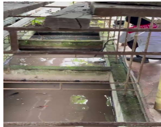
Gambar 3. Budidaya Ikan Air Tawar pada Kolam Terpal