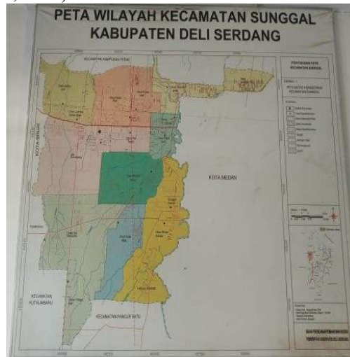
Gambar 1. Peta Wilayah Kecamatan Sunggal Kabupaten Deli Serdang

Profil Kelompok Tani Pondok Miri Asri merupakan kelompok swadaya masyarakat (KSM) yang bergerak di bidang pertanian dan budidaya ikan air tawar. Di bidang pertanian, kelompok tersebut memiliki beberapa kegiatan usaha, yaitu penyemaian bibit produktif seperti pohon buah matoa, mangga, dan simpur. Selain itu, juga terdapat kegiatan usaha pembuatan pupuk kompos dari kotoran hewan ternak dan kegiatan pengolahan sampah plastik. Di bidang budidaya ikan air tawar seperti pada Gambar 2 dan Gambar 3, kelompok tersebut juga menjalani usaha budidaya ikan lele, ikan nila, ikan gurami, dan ikan patin. Desa Sei Semayang memiliki potensi untuk aktivitas pertanian maupun budidaya ikan air tawar karena memiliki suhu udara rata-rata maksimal 29,9 °C dan minimal 26,9 °C. Sedangkan, kelembaban udara rata-rata di antara 73,6% - 83,8% (Waruwu, 2023).