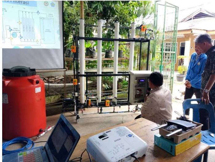
Gambar 5. Pelatihan Instalasi dan Perbaikan Sederhana Alat SIMFATISI