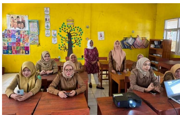
Gambar 2. Demonstrasi Pemanfaatan Media Digital Berbasis Budaya di SD Negeri Setramanah