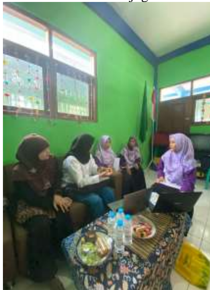
Gambar 1. Pengabdian di TK BA Aisyiyah Baki

pendamping tersebut dilakukan melalui otorisasi dari bendahara TK tersebut (Firmansyah et al., 2022). Proses ini memungkinkan terjadinya alih pengetahuan secara bertahap, sekaligus hal ini dipersiapkan menjadi strategi mitigasi risiko keberlanjutan pengelolaan keuangan sekolah mengingat bahwa bendahara utama TK tersebut akan memasuki masa pensiun. Lebih lanjut, penggunaan excel membantu untuk meningkatkan keteraturan pencatatan dan mempermudah proses penghitungan data keuangan (Rachmanto & Utami, 2024). Hasil pendampingan juga menunjukkan bahwa format laporan keuangan bulanan berbasis excel juga turut membantu pengelola sekolah dalam memahami kondisi keuangan secara lebih ringkas dan informatif (Damayanti & Wafaretta, 2023). Guru pendamping menyampaikan bahwa melalui laporan bulanan tersebut, pemasukan dan pengeluaran sekolah dapat diketahui dengan lebih mudah pada tiap periode, sehingga hal tersebut mempermudah proses evaluasi keuangan bulanan. Kolaborasi antara bendahara dan dua guru pendamping menciptakan pembagian tugas yang lebih proporsional. Hal itu juga menciptakan keterlibatan pengelola sekolah dalam administrasi keuangan. Pendekatan pendampingan ini dinilai lebih efektif karena mempertimbangkan kesiapan sumber daya manusia dan kondisi yang terjadi di mitra. Dengan harapan bahwa perubahan sistem pencatatan keuangan ini tidak hanya bersifat teknis semata namun juga berorientasi pada keberlanjutan.