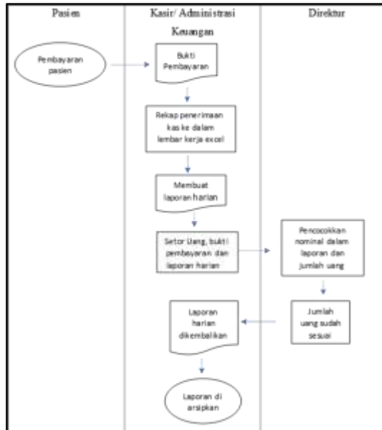
Gambar 1. Sistem Informasi Penerimaan Kas

Seluruh arus kas masuk pada Klinik Utama Nurkhadijah bersumber eksklusif dari aktivitas operasional, tanpa adanya penerimaan yang berasal dari aktivitas pendanaan maupun investasi. Dana yang diterima merupakan hasil pembayaran pasien atas berbagai layanan kesehatan dan tindakan medis yang telah diberikan oleh pihak klinik. Layanan yang menghasilkan penerimaan kas mencakup pelayanan rawat jalan dan rawat inap. Dalam praktik administrasinya, setiap transaksi penerimaan dicatat secara terperinci dalam laporan harian sesuai dengan klasifikasi jenis layanan. Misalnya, pendapatan dari rawat jalan sesi pagi dan sesi sore dicatat secara terpisah. Selain itu, terdapat pemisahan pencatatan untuk penjualan obat bebas tanpa resep dokter, pembayaran layanan rawat inap, jasa laboratorium, serta program edukatif seperti kelas ibu hamil dan kelas bayi. Setiap akhir periode harian, seluruh penerimaan kas direkapitulasi dalam lembar kerja laporan harian, kemudian dana tunai yang terkumpul diserahkan kepada Direktur bersamaan dengan laporan tersebut. Proses pencatatan dan pengolahan data dilakukan dengan memanfaatkan aplikasi Microsoft Excel sebagai alat bantu administrasi. Selanjutnya, data yang telah direkap dalam laporan harian menjadi dasar untuk diinput ke dalam sistem pencatatan utama. Dalam sistem tersebut, seluruh penerimaan diklasifikasikan dan dibukukan berdasarkan akun-akun yang telah ditetapkan sebelumnya guna menjaga keteraturan dan konsistensi pencatatan keuangan.