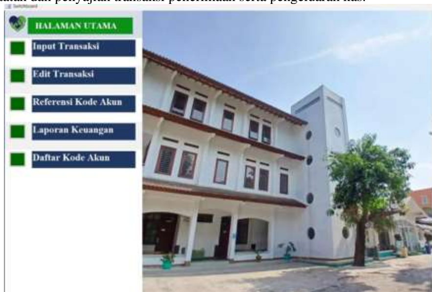
Gambar 4. Tampilan Switchboard

Tampilan utama aplikasi memuat seluruh fitur yang tersedia, seperti formulir input transaksi, menu pengeditan transaksi, pengaturan kode referensi, daftar kode akun, serta akses ke laporan keuangan. Pada bagian laporan keuangan, pengguna dapat memilih jenis laporan yang diinginkan, yaitu jurnal umum, buku besar, laporan operasional, dan laporan arus kas, melalui menu switchboard. Karena aplikasi ini difokuskan pada pengelolaan kas, seluruh menu yang dirancang hanya berkaitan dengan proses pencatatan dan penyajian transaksi penerimaan serta pengeluaran kas.