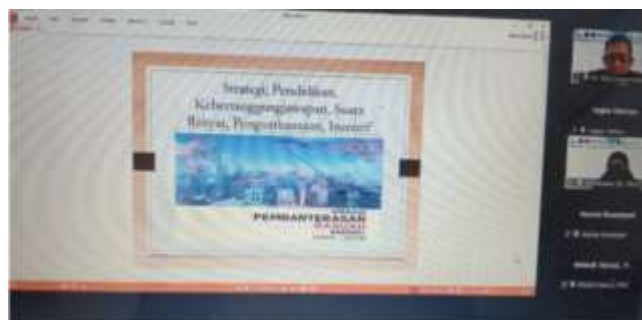
Gambar 1. Presentasi Narasumber PkM