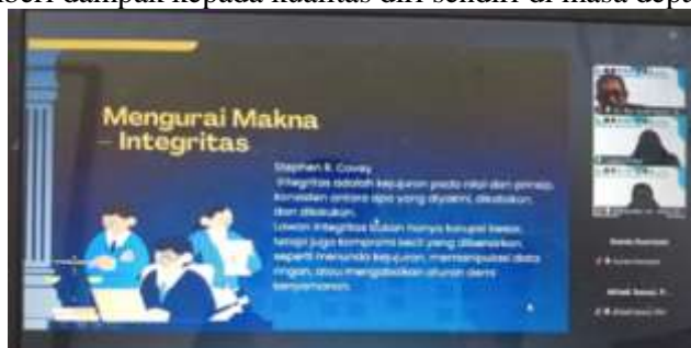
Gambar 2. Materi Presentasi

untuk selalu jujur, tidak melakukan plagiasi dan melakukan komitmen terhadap diri sendiri. Hal-hal kecil tersebut akan memberi dampak kepada kualitas diri sendiri di masa depan sebagai motivasinya.