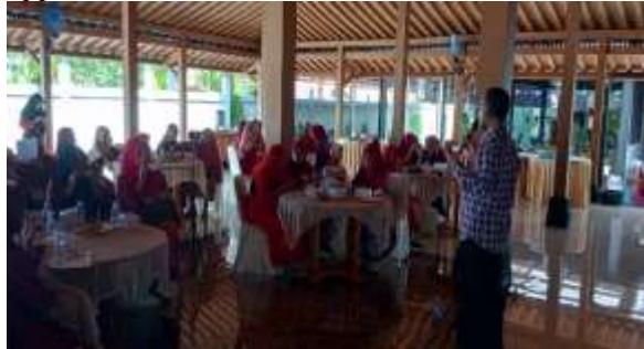
Gambar 1. Penyampaian materi kegiatan

Wadah yang digunakan untuk hidroponik dikenal dengan istilah netpot. Menurut Wibowo (2022) netpot dapat dibuat dari gelas plastik yang dilubangi pada bagian bawah dan bagian samping. Selain itu, diperkenalkan juga tentang pupuk yang digunakan dalam hidroponik, yaitu pupuk AB mix. Pupuk ini disebut AB mix karena sebelum digunakan sebagai larutan nutrisi maka harus dipisah menjadi pekatan A dan pekatan B. Apabila kedua pekatan tersebut tercampur maka akan terbentuk endapan kalsium sulfat ( \text{CaSO}_4 ) dan kalsium fosfat ( \text{Ca}_3(\text{PO}_4)_2 ) yang sulit untuk diserap oleh akar tanaman. Selanjutnya, kedua pekatan tersebut dicampur apabila akan digunakan sebagai larutan nutrisi yang ditambahkan dalam air. Hasil penelitian Wibowo (2021), konsentrasi nutrisi yang paling baik untuk tanaman sawi adalah 1.000 ppm.