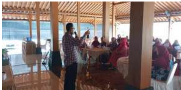
Gambar 2. Diskusi tentang urban farming dan hidroponik