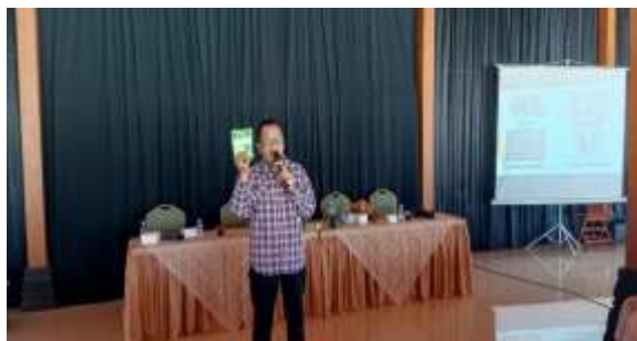
Gambar 3. Penjelasan tentang media tanam, netpot, dan pupuk hidroponik