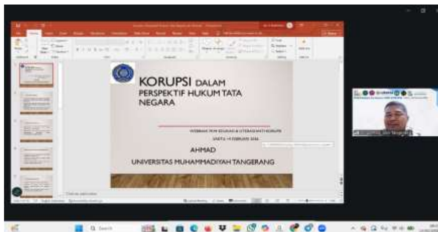
Gambar 1. Presentasi oleh Narasumber

Hasil pelaksanaan kegiatan Pengabdian kepada Masyarakat menunjukkan adanya peningkatan literasi hukum peserta terkait isu anti korupsi. Peserta memperoleh pemahaman yang lebih komprehensif mengenai konsep dan definisi korupsi dalam perspektif hukum positif Indonesia, termasuk karakteristik serta ruang lingkup tindak pidana korupsi sebagai kejahatan luar biasa. Pemahaman ini menjadi penting mengingat masih adanya kesalahpahaman di masyarakat dalam membedakan antara pelanggaran administratif, pelanggaran etika, dan tindak pidana korupsi yang memiliki konsekuensi hukum serius (Transparency International, 2023).