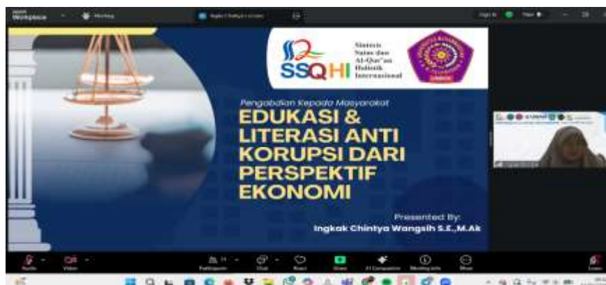
Gambar 1. Presentasi Narasumber

kesejahteraan masyarakat. Selanjutnya, peserta dilibatkan secara aktif melalui sesi diskusi dan tanya jawab yang dirancang untuk menggali persepsi, pengalaman, dan pandangan kritis peserta terkait praktik korupsi dalam kehidupan sehari-hari. Pendekatan ini diharapkan mampu memperkuat pemahaman konseptual sekaligus membangun kesadaran kritis peserta.